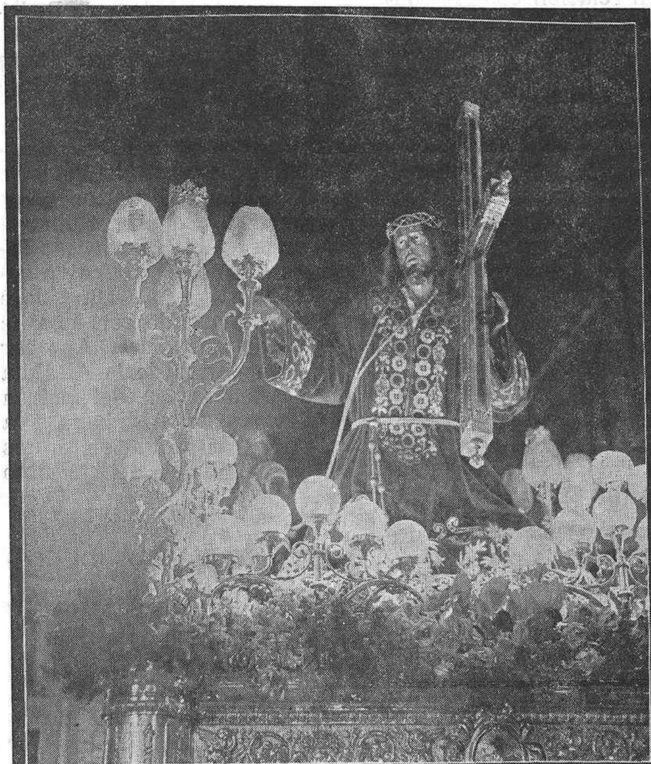
efeso titular de la Cofradía del Perdón, Saltillo

Editado por el Excmo. Ayuntamiento de Orihuela * N.º 18 * Marzo 1977