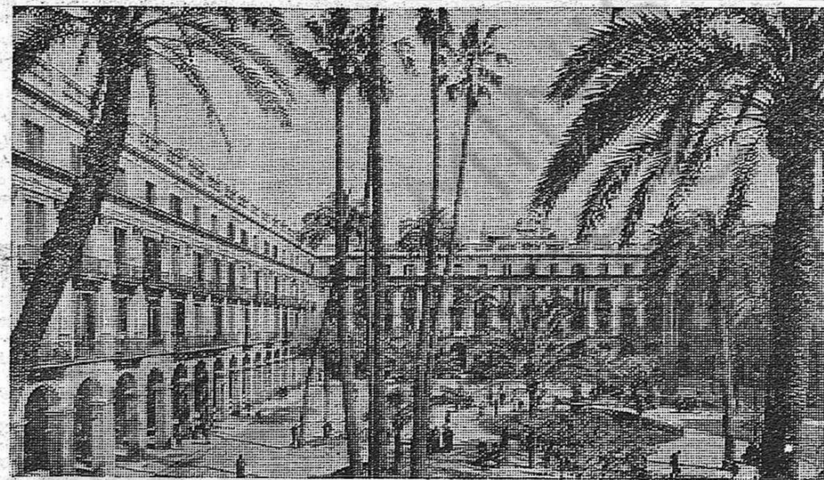
Nuestra foto : BARCELONA, plaza Real