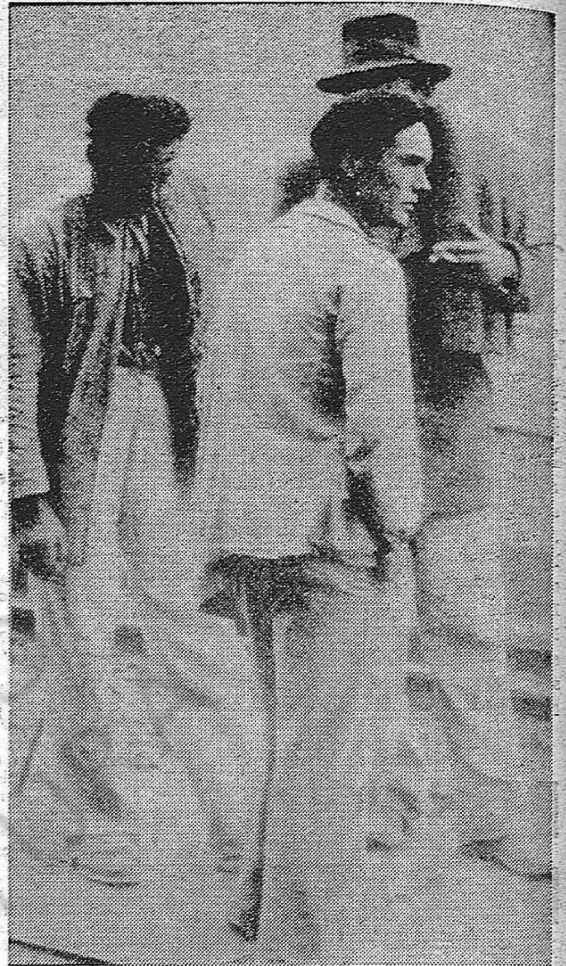
« Es imposible continuar así », dicen los trabajadores.

Dos manifestaciones obreras, apoyadas por estudiantes, por intelectuales, con la simpatía manifiesta del pueblo, que desde las siete a las nueve de la noche ha lanzado a los cuatro vientos la exigencia de toda España: democracia y libertad.