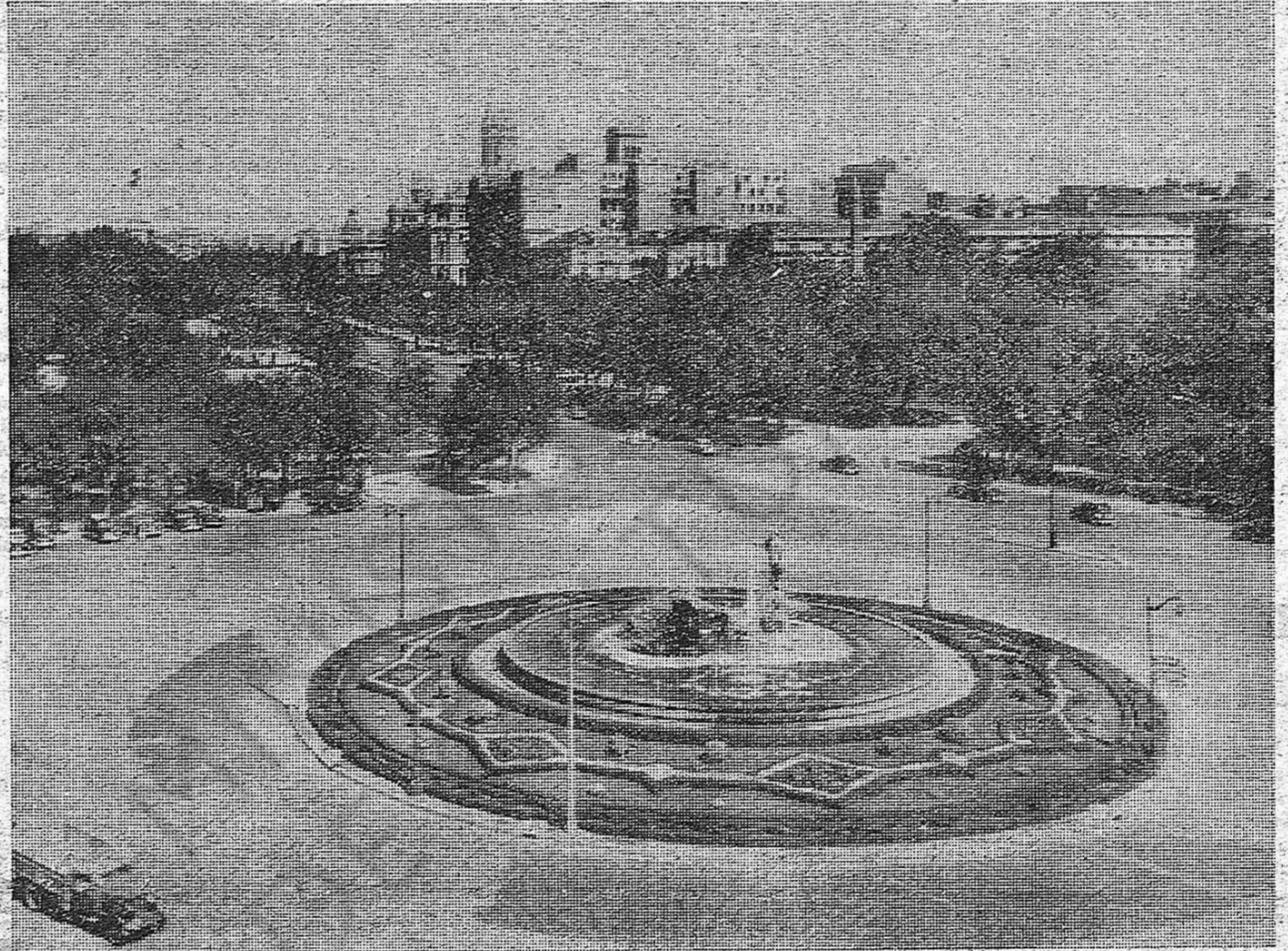
Madrid, Fuente de Nepturo. — Imponentes manifestaciones han recorrido las calles de la capital.