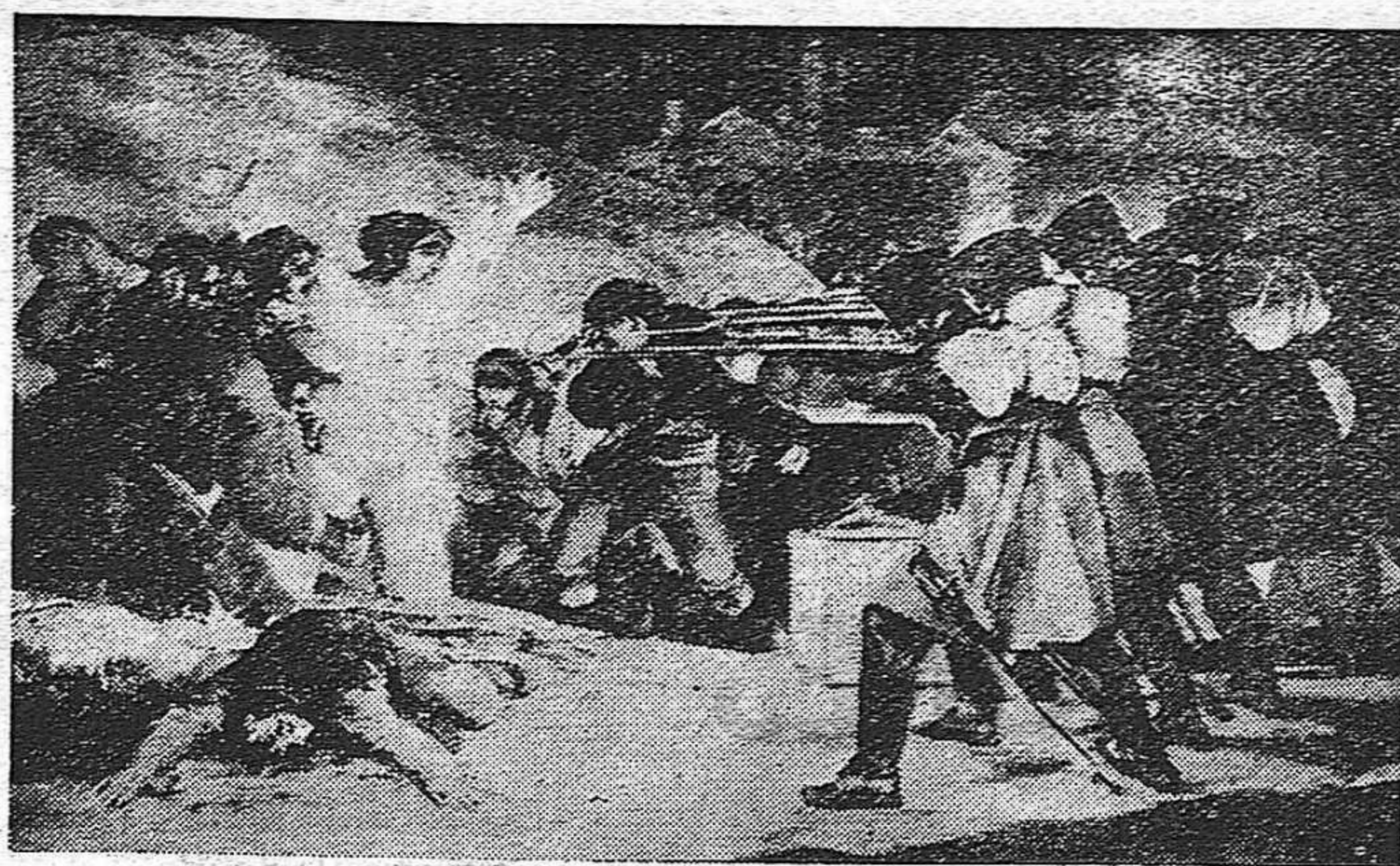
GOYA. « Los Fusilamientos del 3 de Mayo ». Museo del Prado. Madrid.

Si el dos de Mayo de 1808 fué un día de fuego, hoguera luminosa donde el pueblo de Madrid moría con gusto, alegre en su furia contra el invasor odiado, el amanecer del tres de Mayo fué un amanecer de hielo. El levantamiento había fracasado y aún los más pacíficos, los que no se dejaron abrasar la víspera, debían pagar por la ciudad que había osado rebelarse contra el omnipotente Napoleón. En las lomas del Príncipe Pio, por encima del lugar que ocupa hoy la estación del Norte, los culpables y los inocentes eran exterminados sin piedad por las tropas francesas.