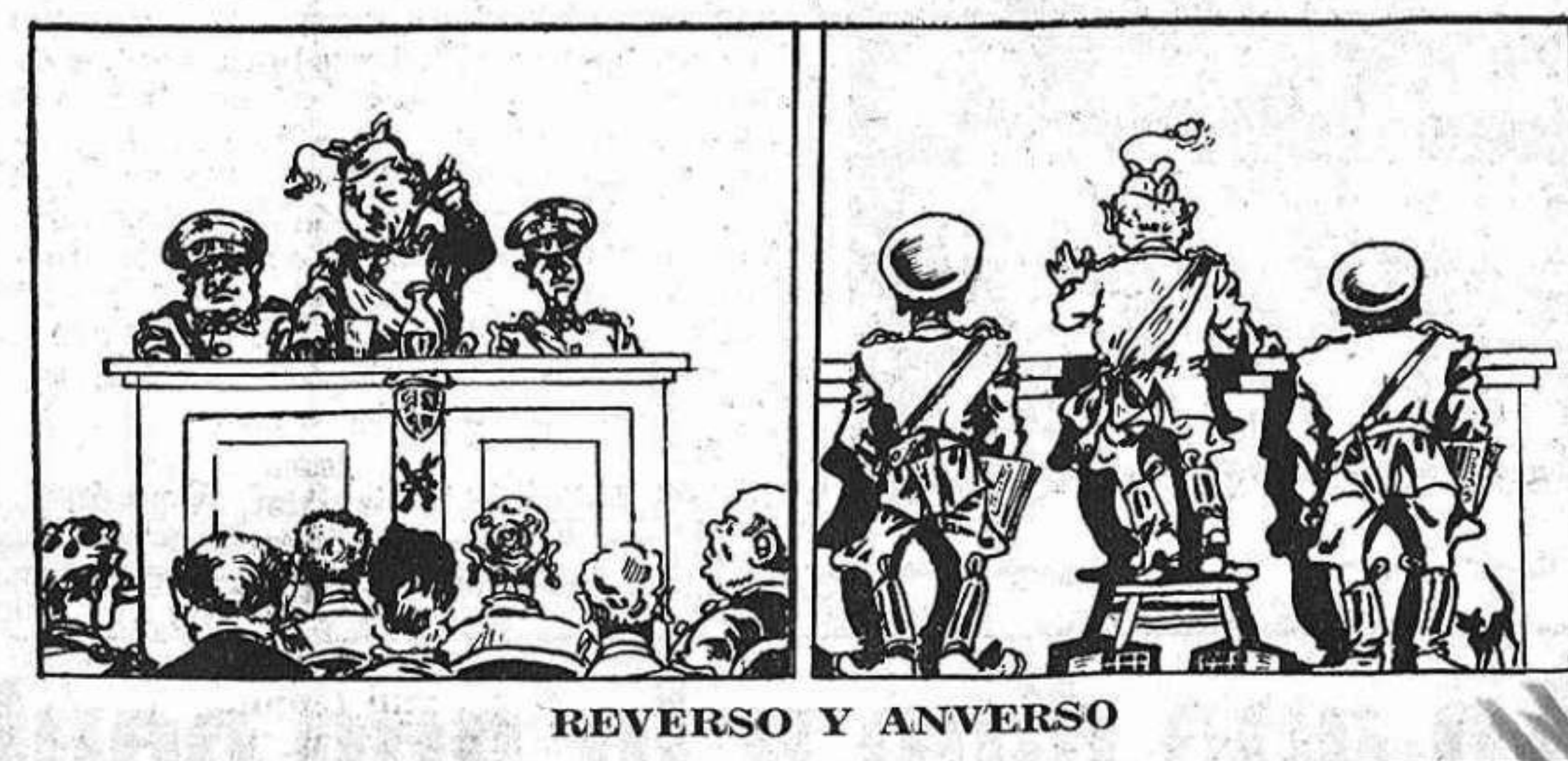
REVERSO Y ANVERSO

Bélgica, Argentina, Africa del Norte, México, Venezuela, Canadá. Se adhieren al Pleno sin enviar acuerdos: Bolivia y Chile.