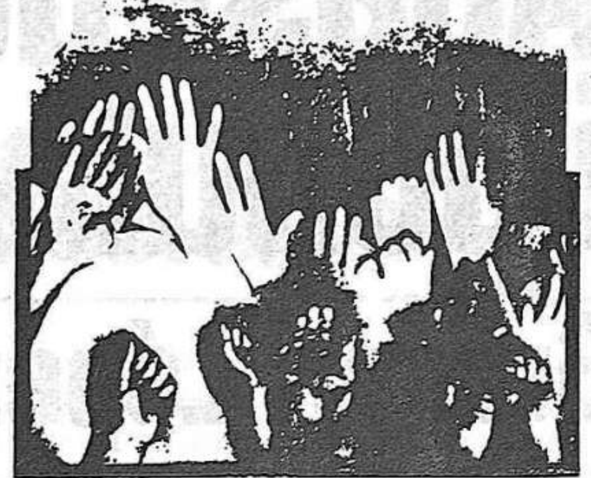
SEAT de la ocupación al VII convenio un nuevo año de lucha obrera