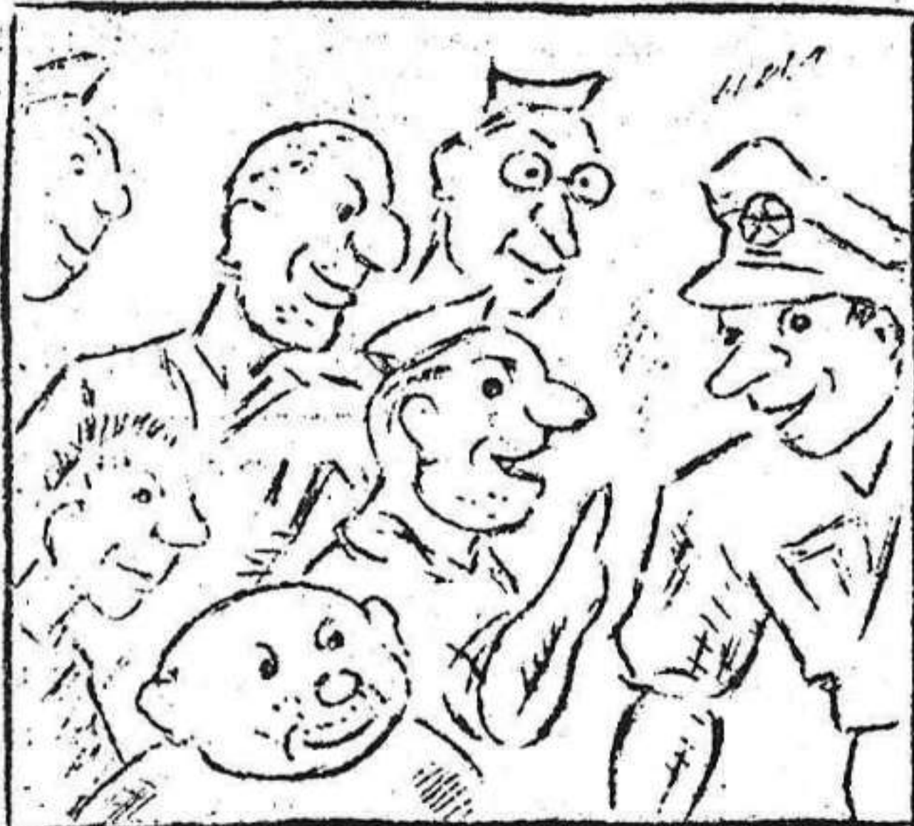
1. El Comisario demanda: ese moro, donde anda?

AVENTURAS DE "MACUTO", primo hermano de Canuto. - Nº 21. El afeitado. -