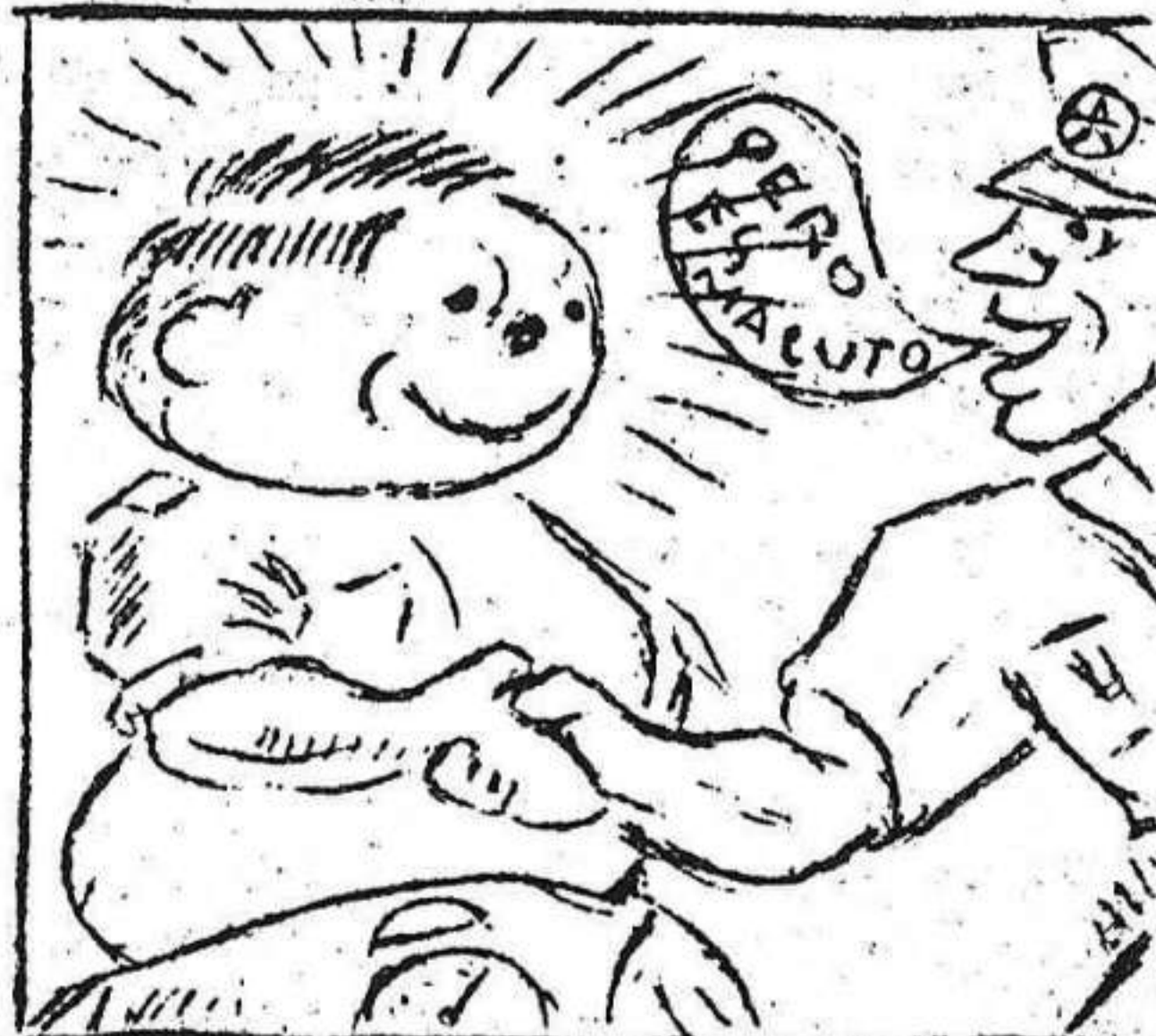
2. Pronto lo ha reconocido y la mano le ha tendido.