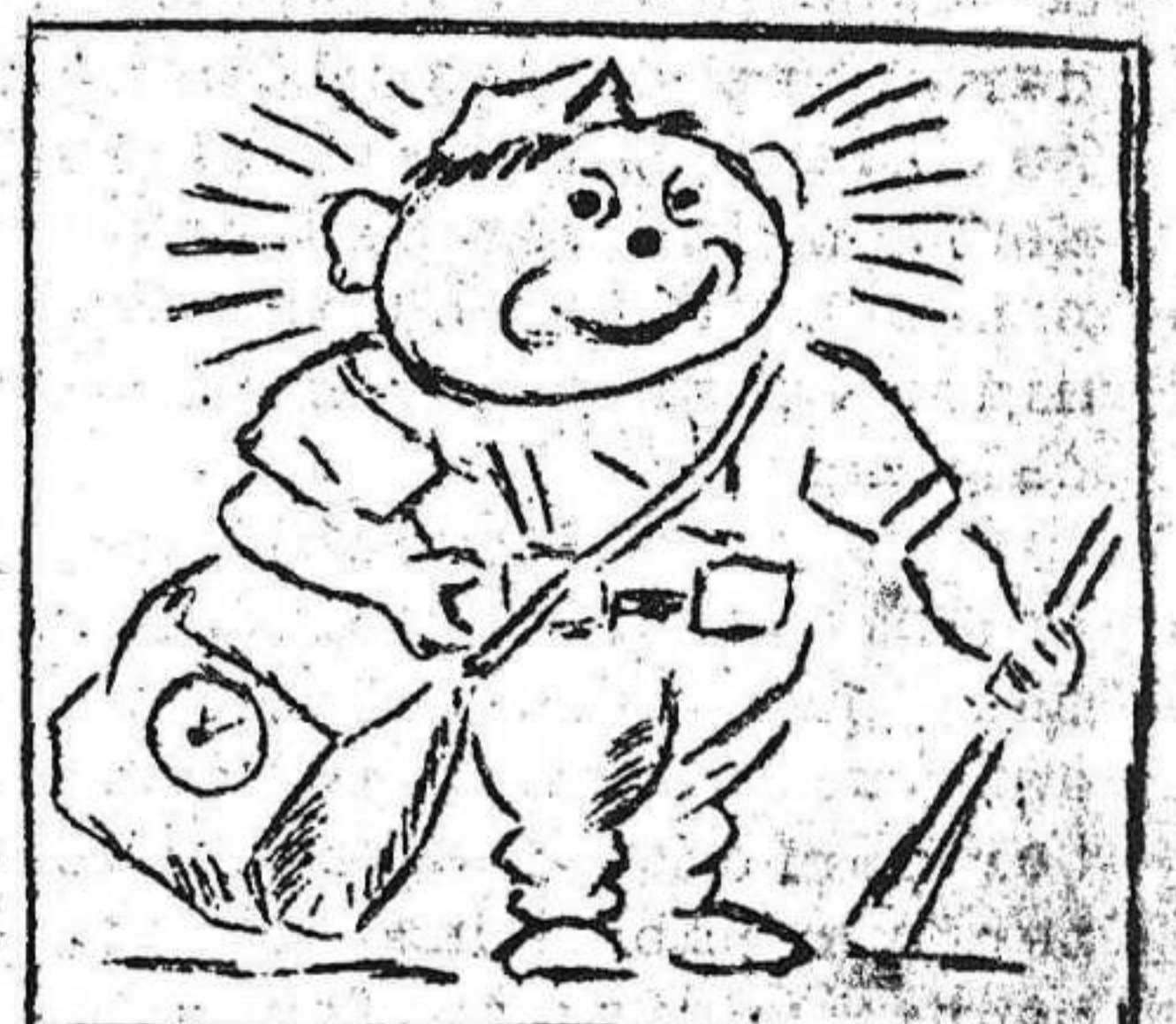
3. Orgulloso y muy contento, vuelve a su escuadra al momento