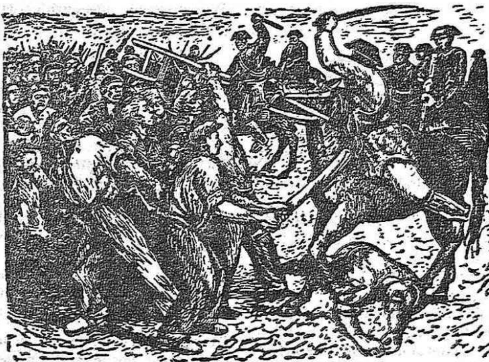
Luchas obreras en España (dibujo del artista brasileño Adolfo Mezzano).

En la declaración se dice que la provocación de las au- (Pasa a la página 8)