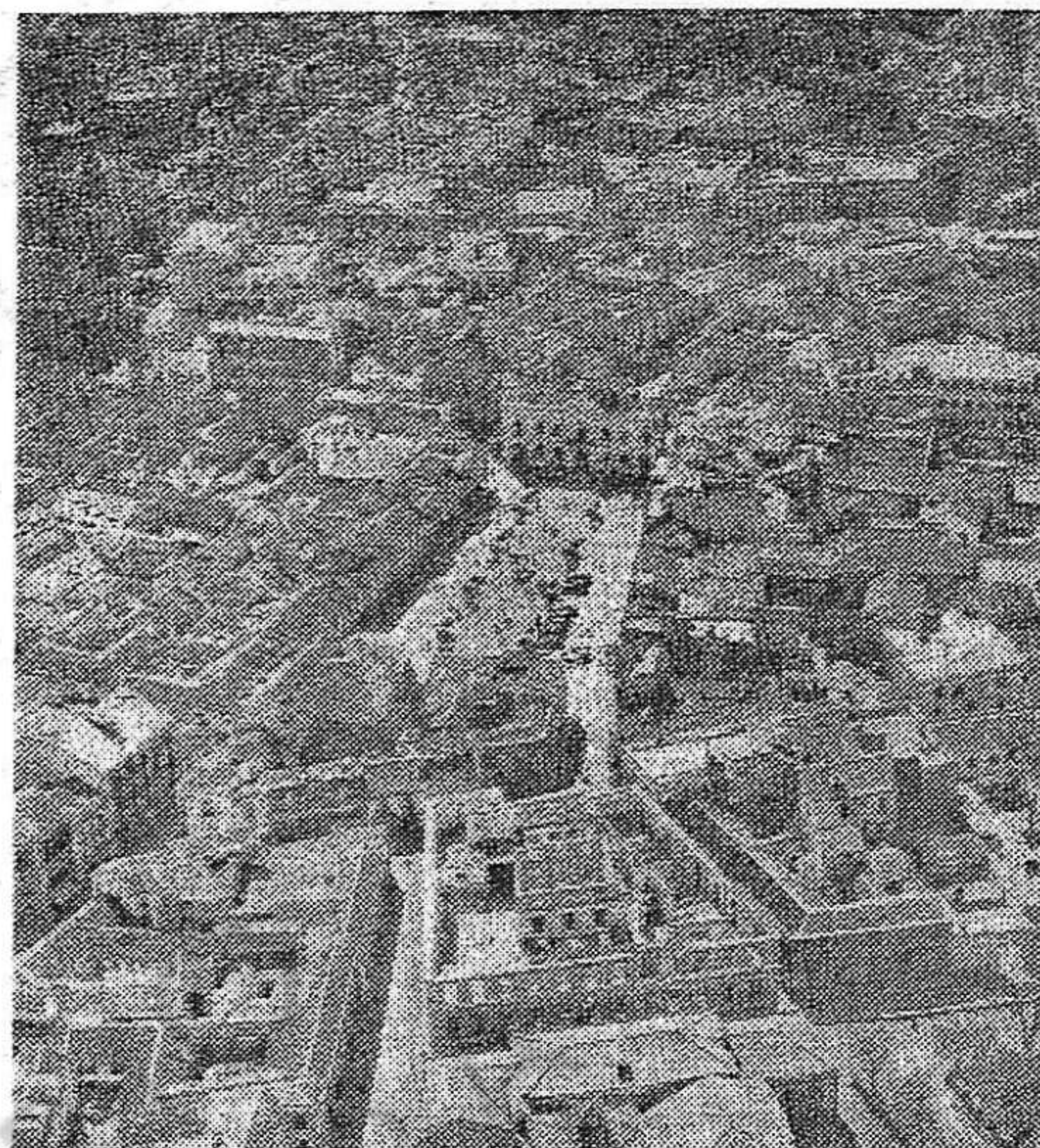
Vista aérea de Ciudad Real

Los obreros piden aumento de sueldo, no limosnas. Mientras la empresa ha duplicado los beneficios en unos años, los obreros han visto disminuidos sus ingresos en 6,000 pesetas anuales.