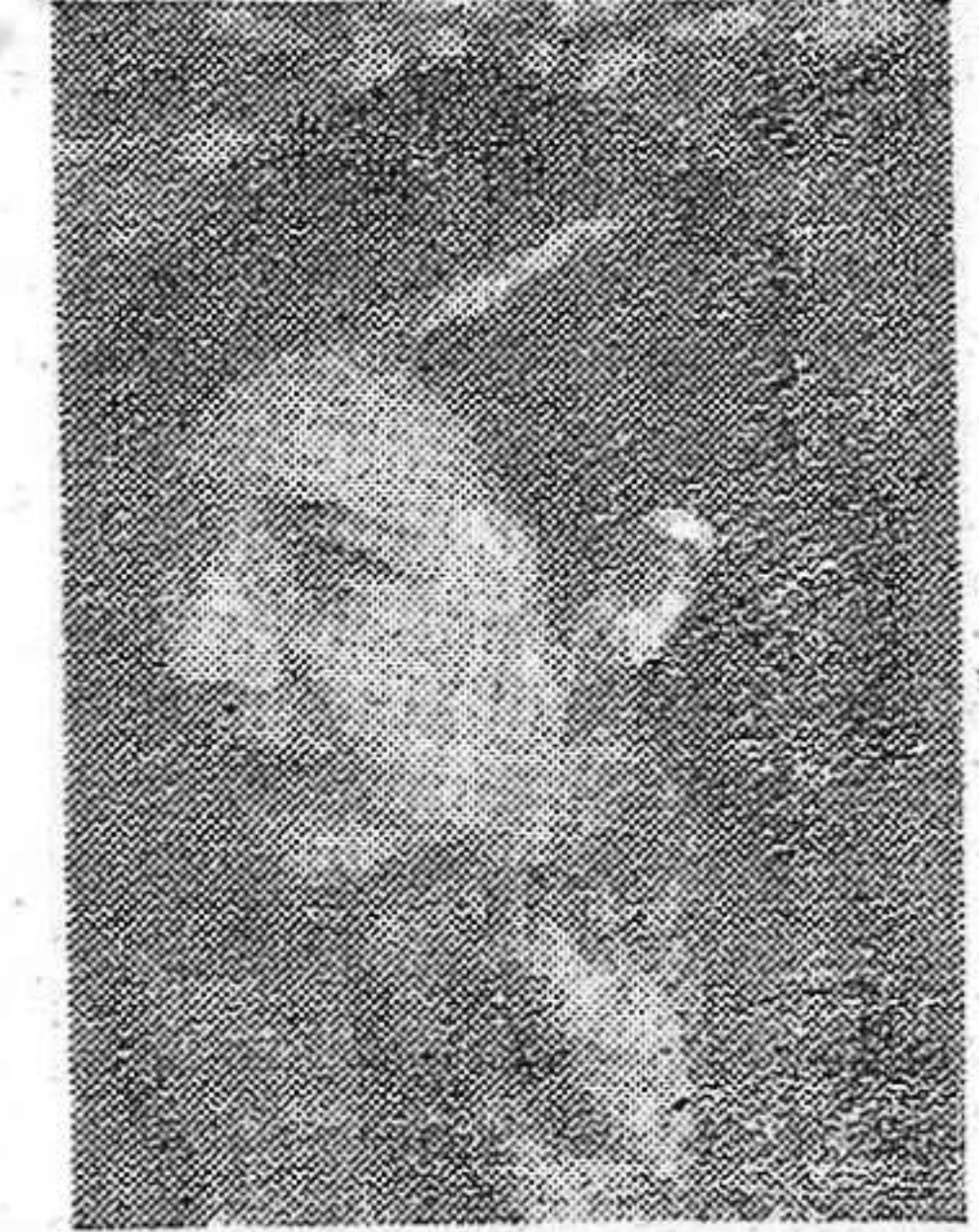
Ana María Matute

tóricas en que se desenvuelven la creación y la crítica literaria españolas para dar una respuesta en bloque, de conjunto.