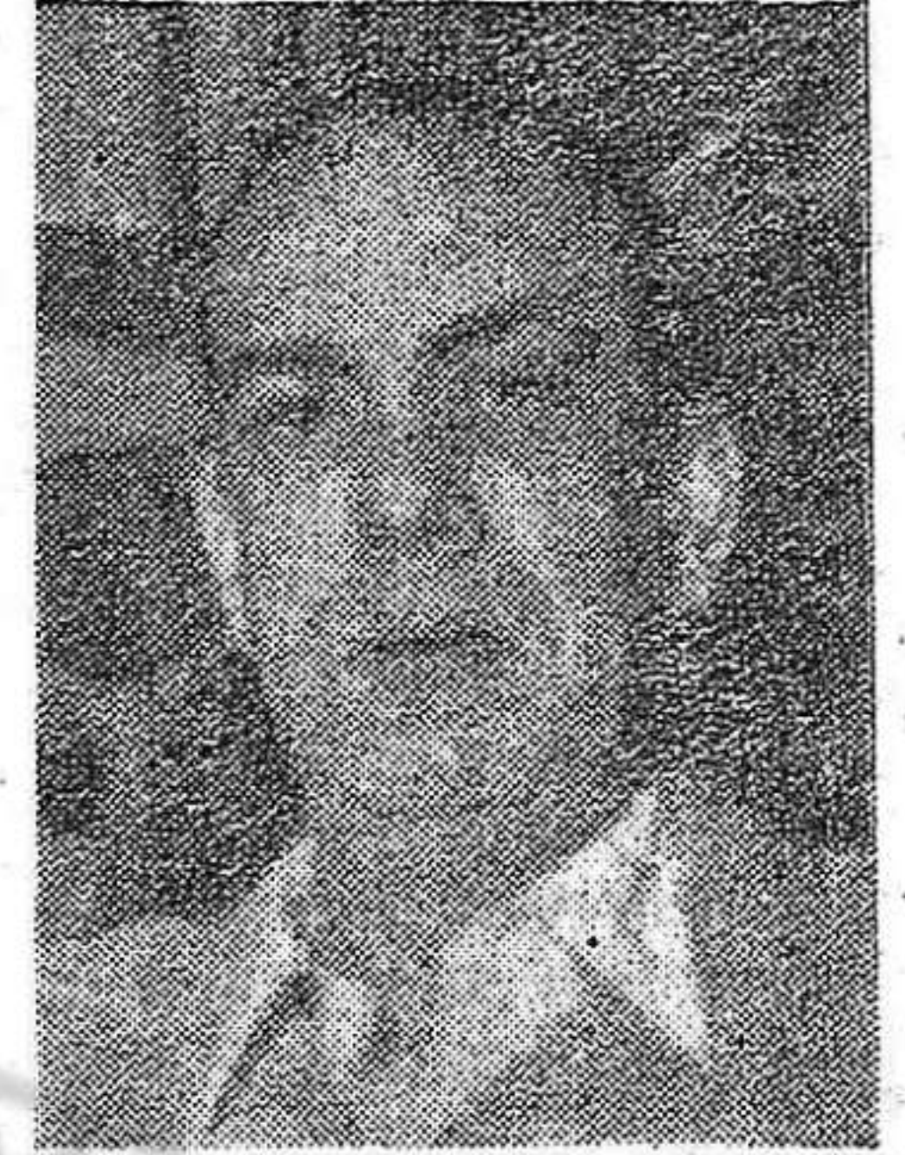
Camilo José Cela

A nuestro entender es demasiado pronto y son demasiado difíciles las circunstancias his-