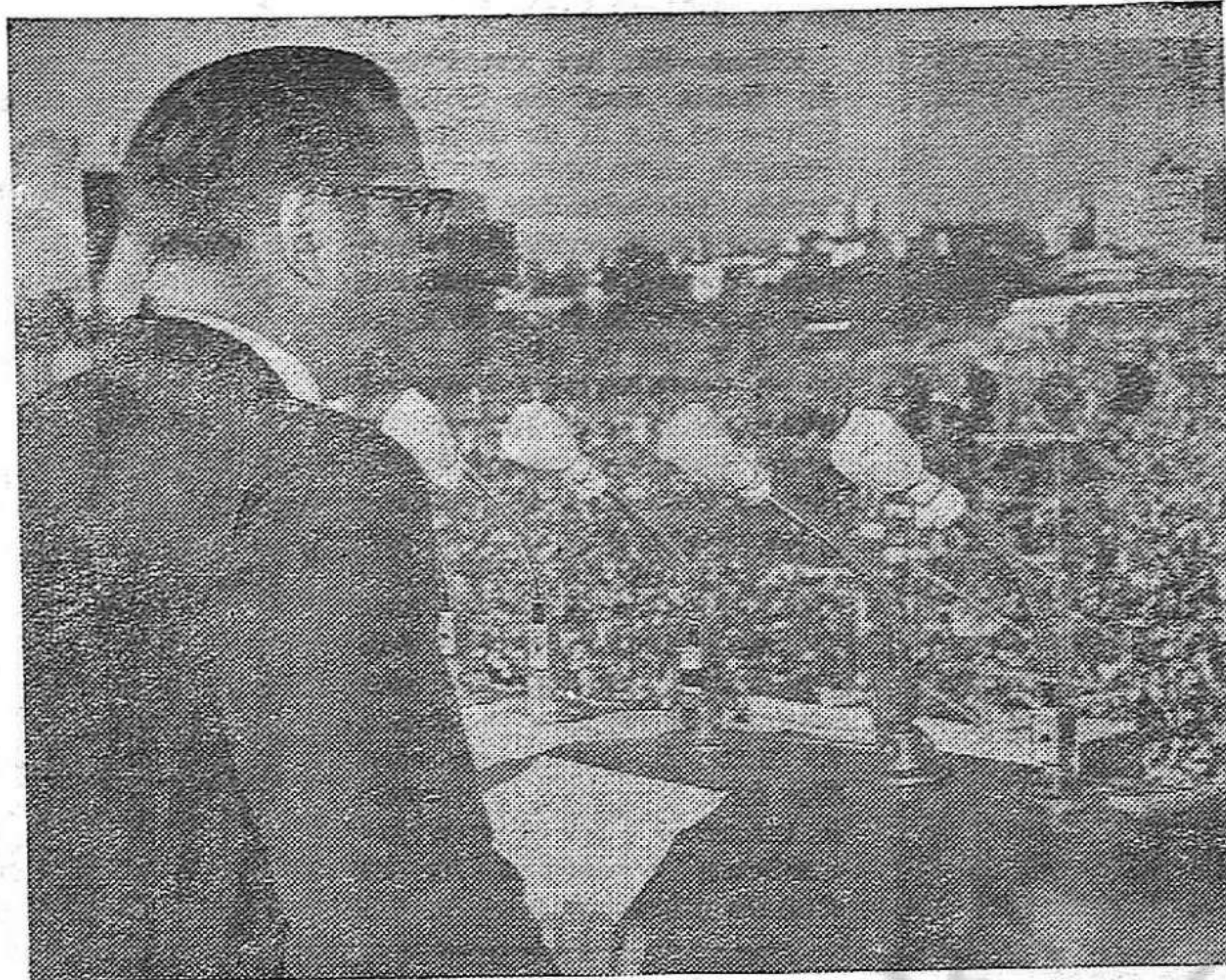
El Presidente doctor Osvaldo Dorticós Torrado, explicó en gran discurso el día 4 de Febrero la significación de la Conferencia de Punta del Este.

¿Cómo han de creer en este imperialismo, en sus beneficios, en sus "alianzas" (que no sean para lincharlos o explotarlos como esclavos) estos núcleos étnicos preteridos?