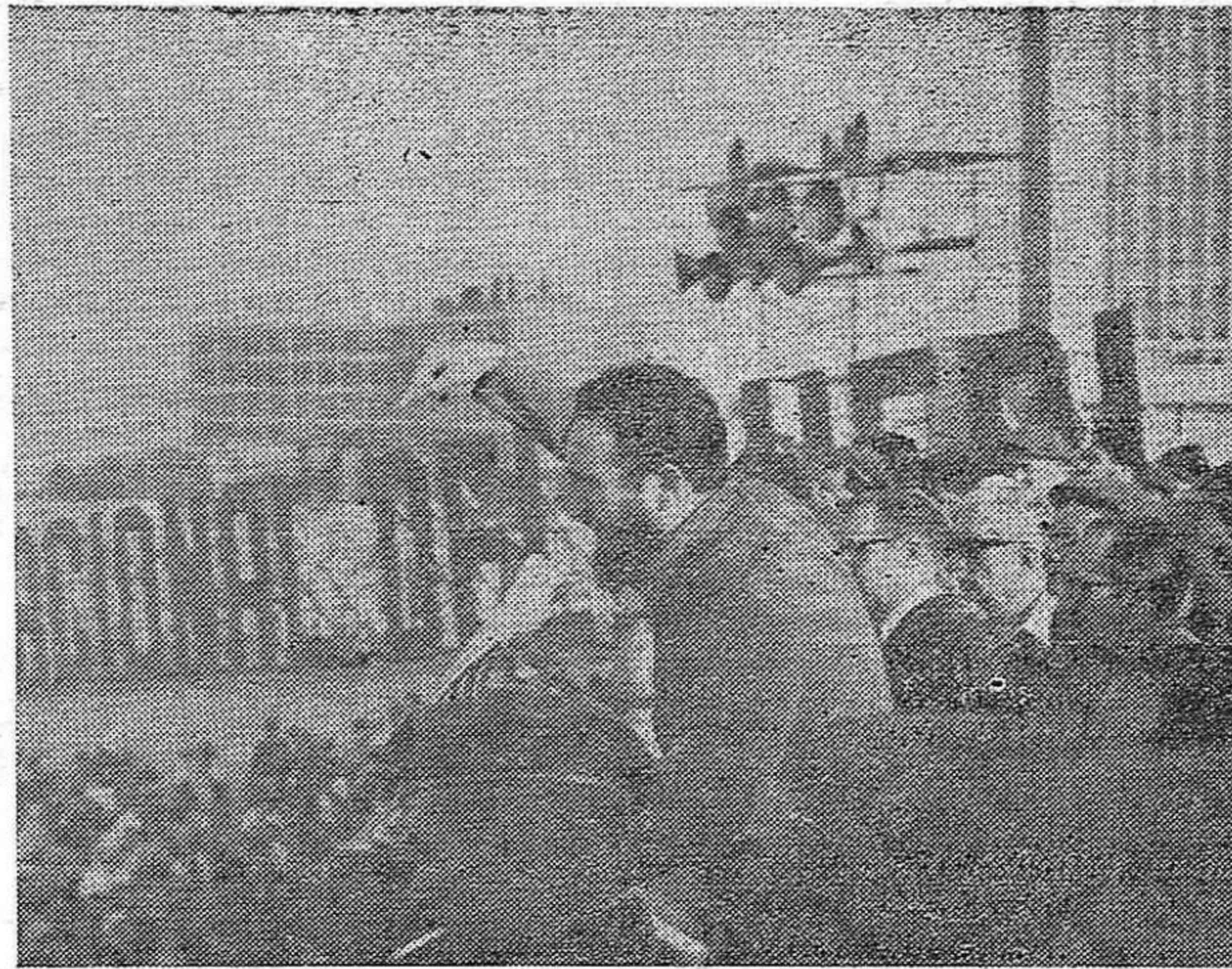
El doctor Fidel Castro Ruz, en los momentos en que leía ante el pueblo de Cuba, la Segunda Declaración de La Habana.

En los comicios electorales realizados en Cuba al viejo estilo burgués, el Presidente que mayor número de votos obtuvo, nunca sobrepasó el del millón de electores. Así, haciendo abstracción de los métodos que se utilizaban para la obtención de aquellos votos, no refiriéndonos a las presiones económicas y políticas que se ejercían sobre los electores, olvidando la vergonzosa compra-venta de cédulas electorales, no teniendo en cuenta los "forros", los especialistas en "boletas mensajeras", las maniobras de los "sargentos políticos" y demás chanchullos que se hacían para impedir que se expresara en verdad la voluntad del