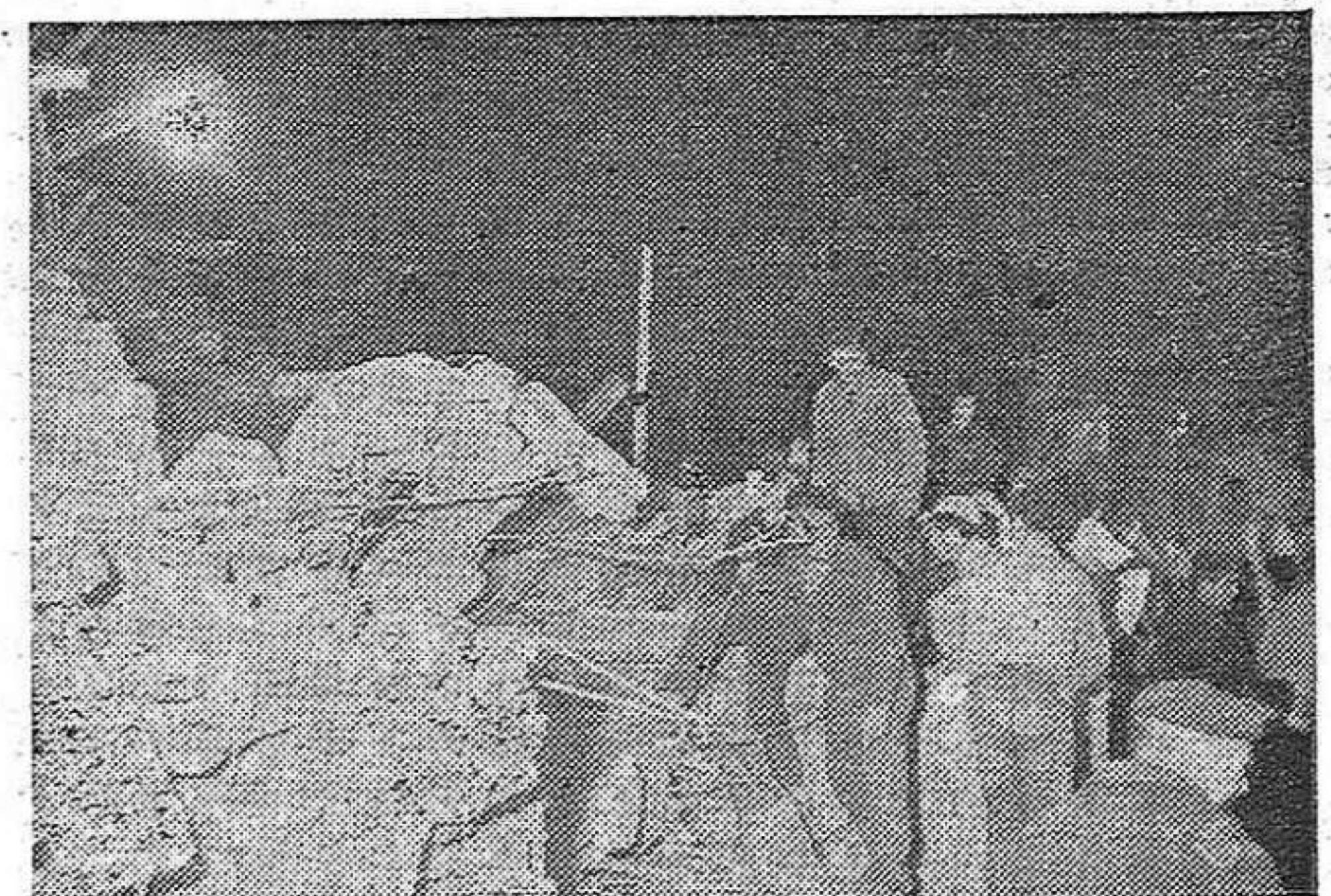
Una de las fotos que desgraciadamente tenemos que reiterar en esta sección. En la villa barcelonesa de Pineda se derrumbó una casa en construcción. Entre sus escombros quedaron atrapados 80 obreros de los 500 que normalmente trabajaban en las obras. Resultaron muertos diez y hubo 34 heridos. Algunos obreros permanecieron entre los escombros más de 24 horas. (Foto Prensa Latina).