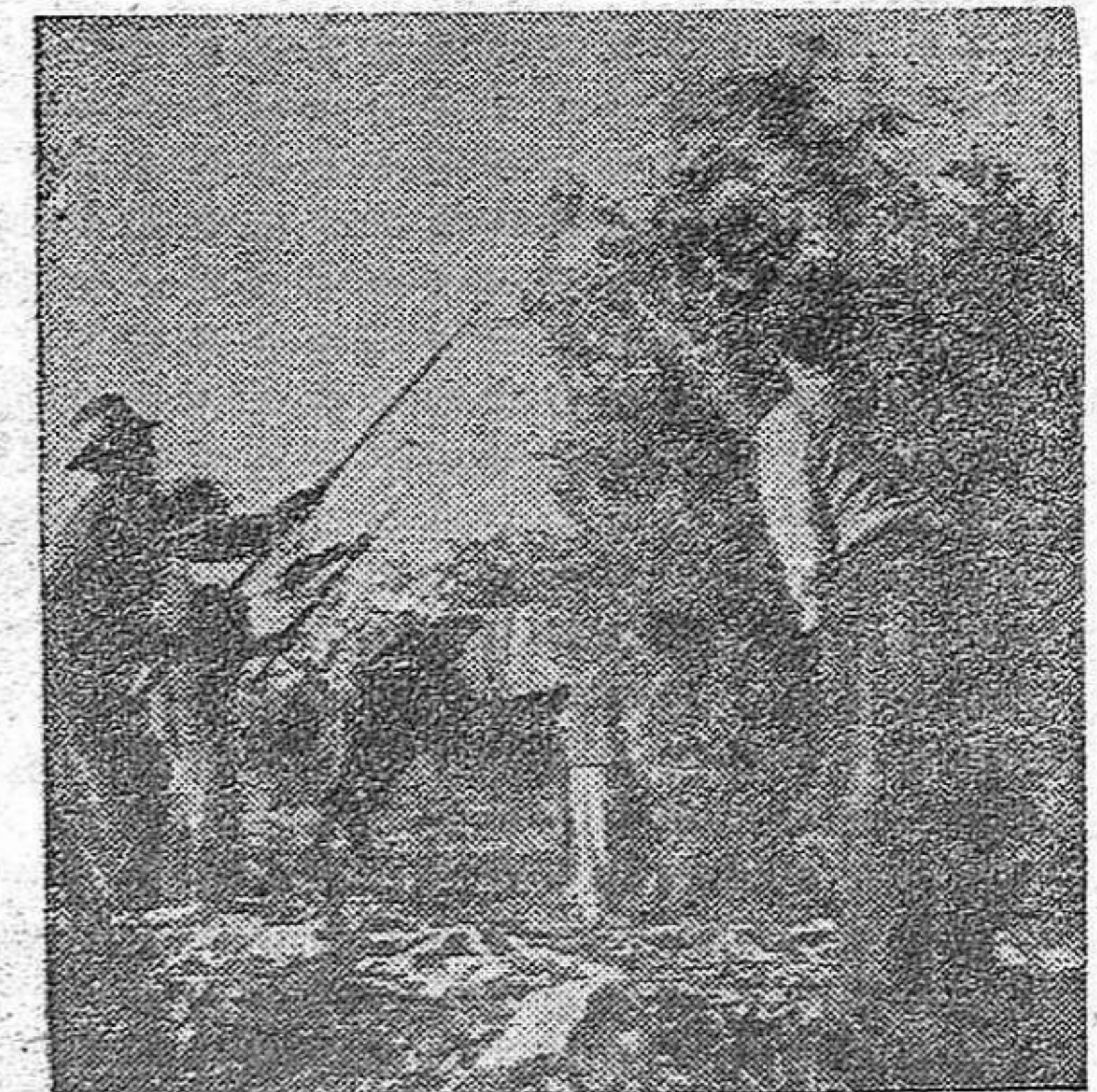
Vareando la aceituna en el campo andaluz

¿ardemos sin quemarnos? ¿No hay salida? ¿nos encadena el fuego o nos libera?