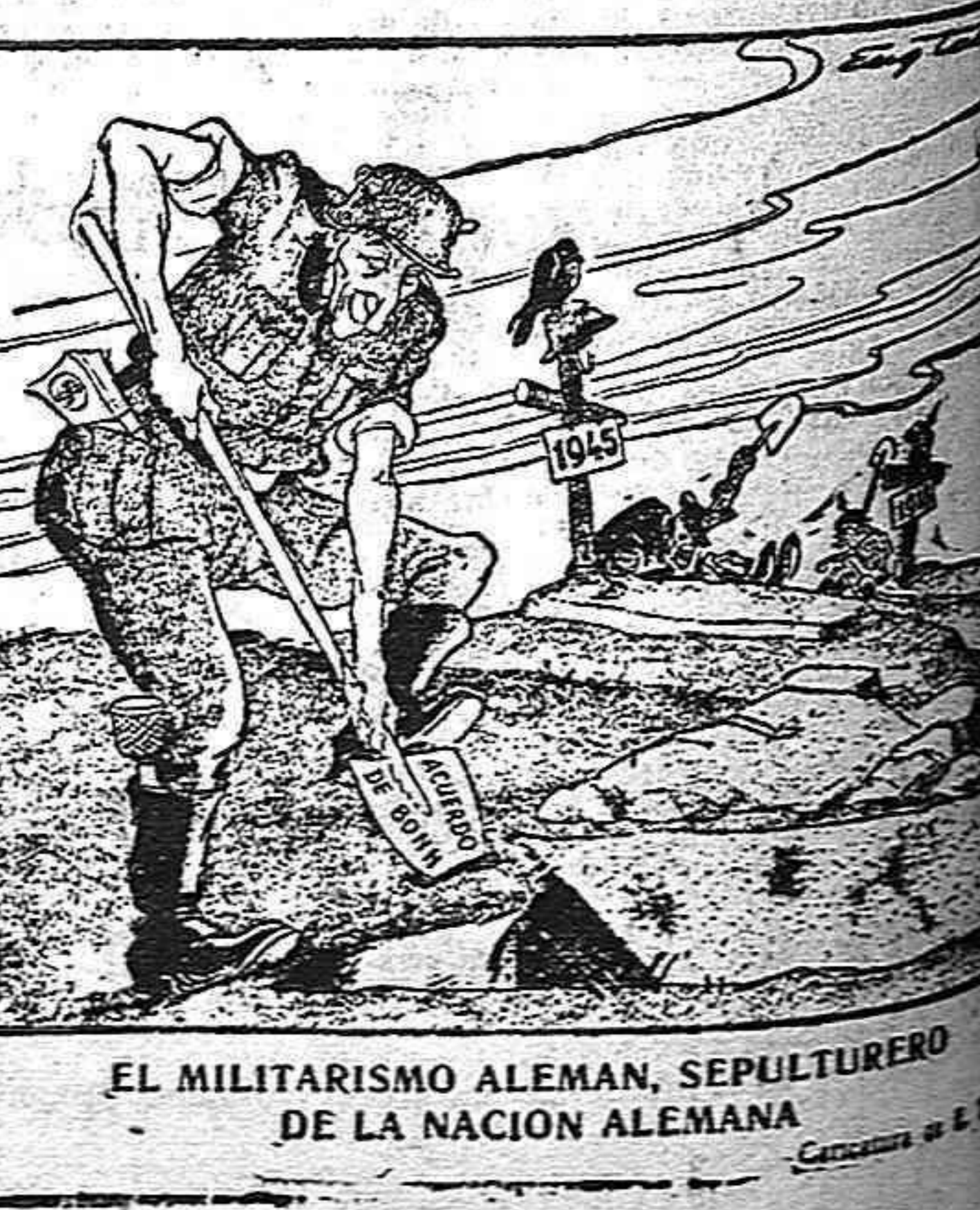
EL MILITARISMO ALEMÁN, SEPULTURERO DE LA NACION ALEMANA