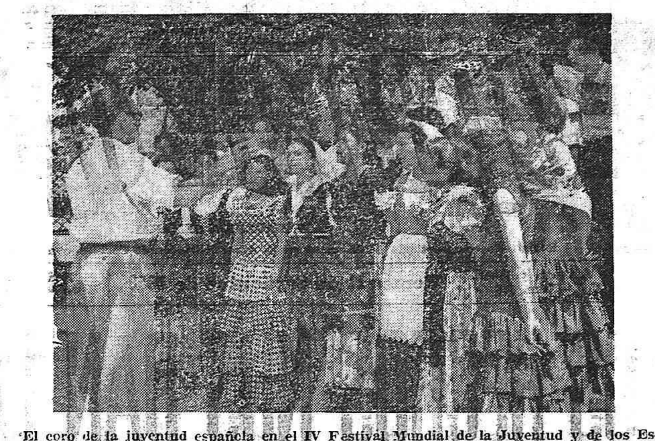
El coro de la juventud española en el IV Festival Mundial de la Juventud y de los Estudiantes, celebrado recientemente, en Bucarest.

los increíbles sufrimientos que el pueblo español ha padecido y padece a causa del franquismo, y temen su justa indignación. Ese temor han conseguido contagiarlo a capas y sectores que no deberían temer al pueblo, que tienen mucho más que temer del puñado de grandes financieros y terratenientes que les arruinan y que invitan a participar en el banquete de sus despojos a los financieros yanquis. Llevados de ese miedo pueril algunos elementos, no sólo en el interior, sino en la emigración, suspiran por una solución "ideal" que permitiese arreglar las cosas sin dar participación a las masas populares, implorándola del mismo Franco. "Hasta cuándo van a continuar marchando hacia la catástrofe esas fuerzas por miedo al pueblo?" Todo depende, en buena parte, de nuestro trabajo, y la marcha de los acontecimientos, aunque más lenta de lo que deseáramos, lo demuestra. Mientras el enemigo se descomponen, mientras crece la protesta popular y nacional, las corrientes de unidad antifranquista progresan y llegarán un momento en que se harán irresistibles. Uno de los