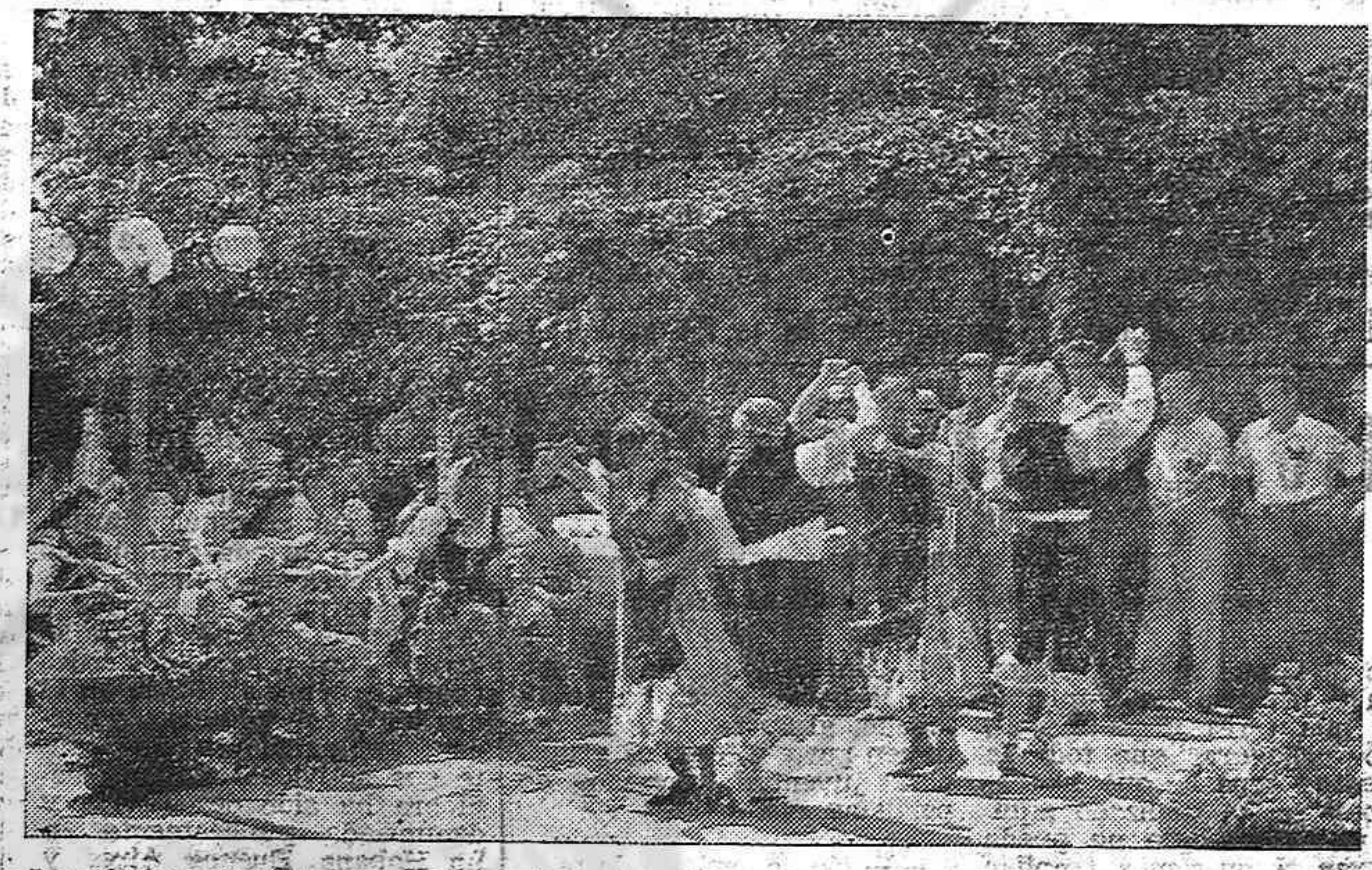
Los jóvenes españoles en el IV Festival ofrecieron a sus compañeros de otros países, la alegría y el sabor de nuestras fiestas españolas.

Entre las numerosas actividades desarrolladas, o por realizarse, con motivo de esta campaña pro "España y la Paz" figura el festival celebrado en la Casa de España de Montevideo, el 16 de agosto, organizado por la Comisión Española de la Paz; la exposición que se inaugurará el 5 de septiembre y en la que se reflejará la labor realizada por "España y la Paz"; la celebración por el Comité Astur-Montañés del "Día de Asturias", en homenaje, igualmente, a este magnífico exponente de la lucha de los españoles por la paz.