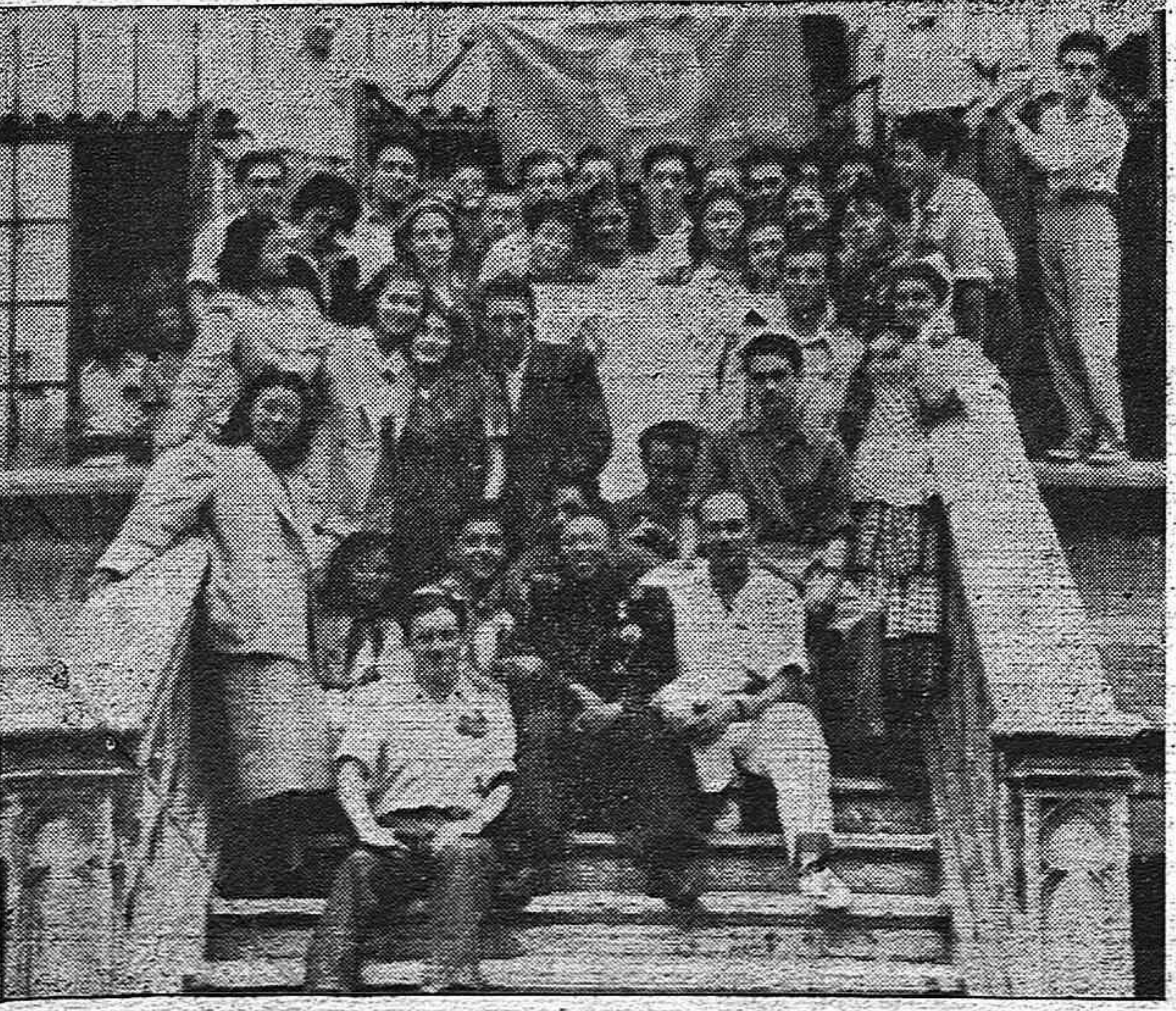
Los jóvenes españoles con los heróicos jóvenes coreanos, en la fiesta fraternal hispano-coreana durante el IV Festival.