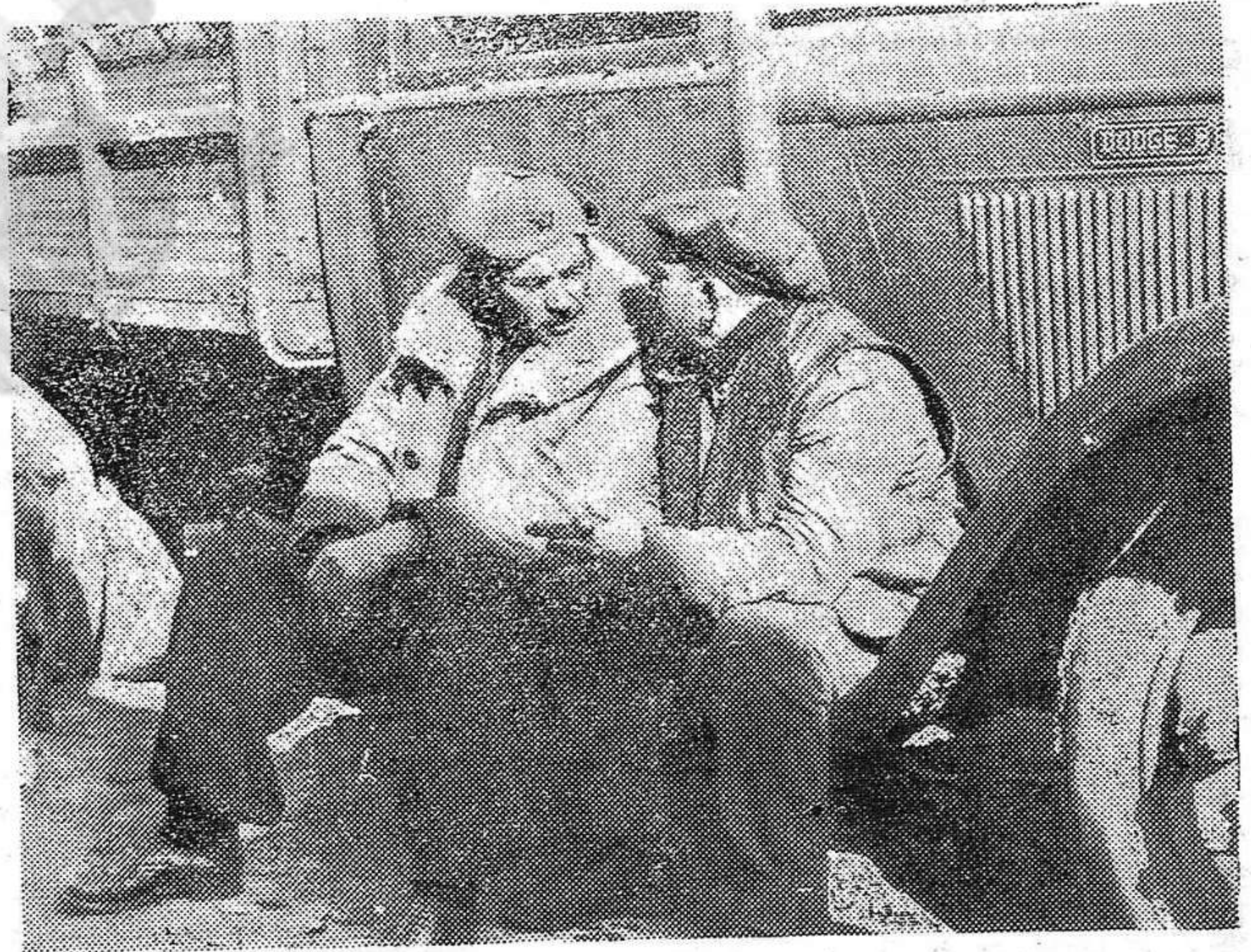
A la izquierda, Hans Beimler, miembro del Comité Central del Partido Comunista alemán y responsable político de los Batallones Alemanes de la Brigada Internacional, caído anteayer heroicamente en los frentes de Madrid.