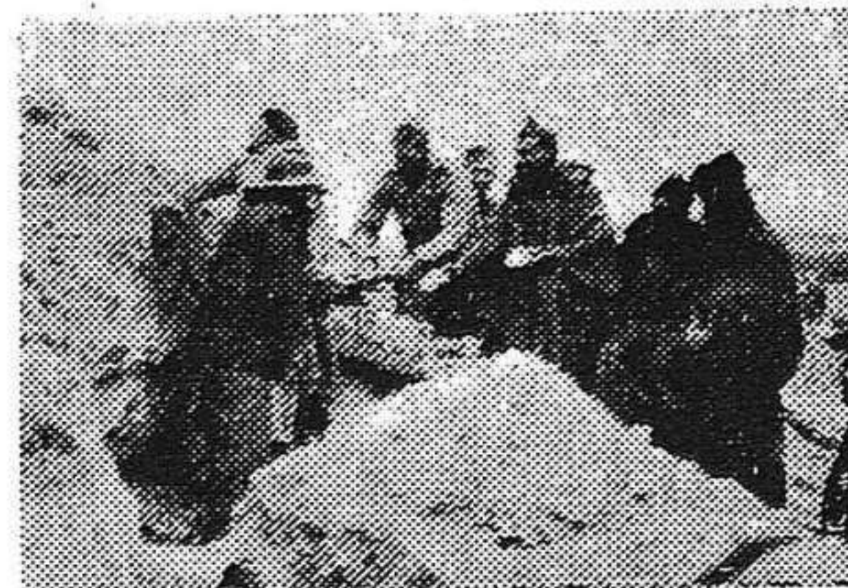
Escenas del frente

Dijo el coronel que quería expresar su gratitud al pueblo de Barbastro, a los milicianos catalanes que con él han compartido los días amargos de lucha contra el fascismo. “Recibid mi gratitud, que es grande hacia vosotros en los momentos trágicos de la lucha, en los momentos en que supisteis escuchar mi voz alentadora para acudir a los puestos de peligro. Un recuerdo a los camaradas caídos en la lucha. Y la esperanza de que este sublime ejemplo dado por ellos sea el aliento más fuerte para vuestros pechos, libres hoy día y libres en el porvenir del fascismo. Mi gratitud al pueblo ruso, que nos ha ayudado moralmente para contribuir a la derrota del fascismo. Mi gratitud a todos vosotros, y tened la seguridad de que el camarada Villalba será el primero en caer al frente de vosotros antes de que el fascismo pise las raras de Aragón.”