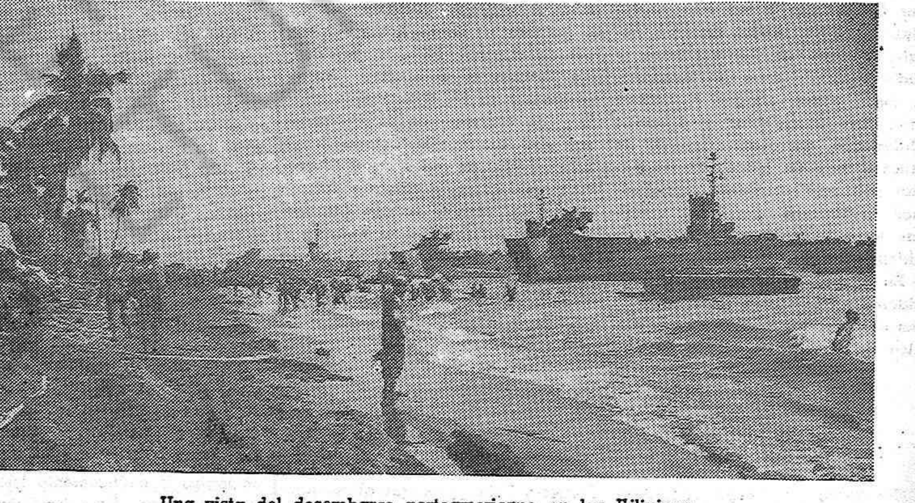
Una vista del desembarco norteamericano en las Filipinas.

Se ruega a todas las personas y organizaciones que estén de acuerdo con el texto del presente mensaje y con dar su respaldo solidario a la campaña que iniciamos para combatir el recrudescimiento del terror franquista que en estos momentos azota al pueblo español, envíen sus adhesiones a la F.O.A.R.E., Paseo de la Reforma No. 9 Desp. D., México, D. F.