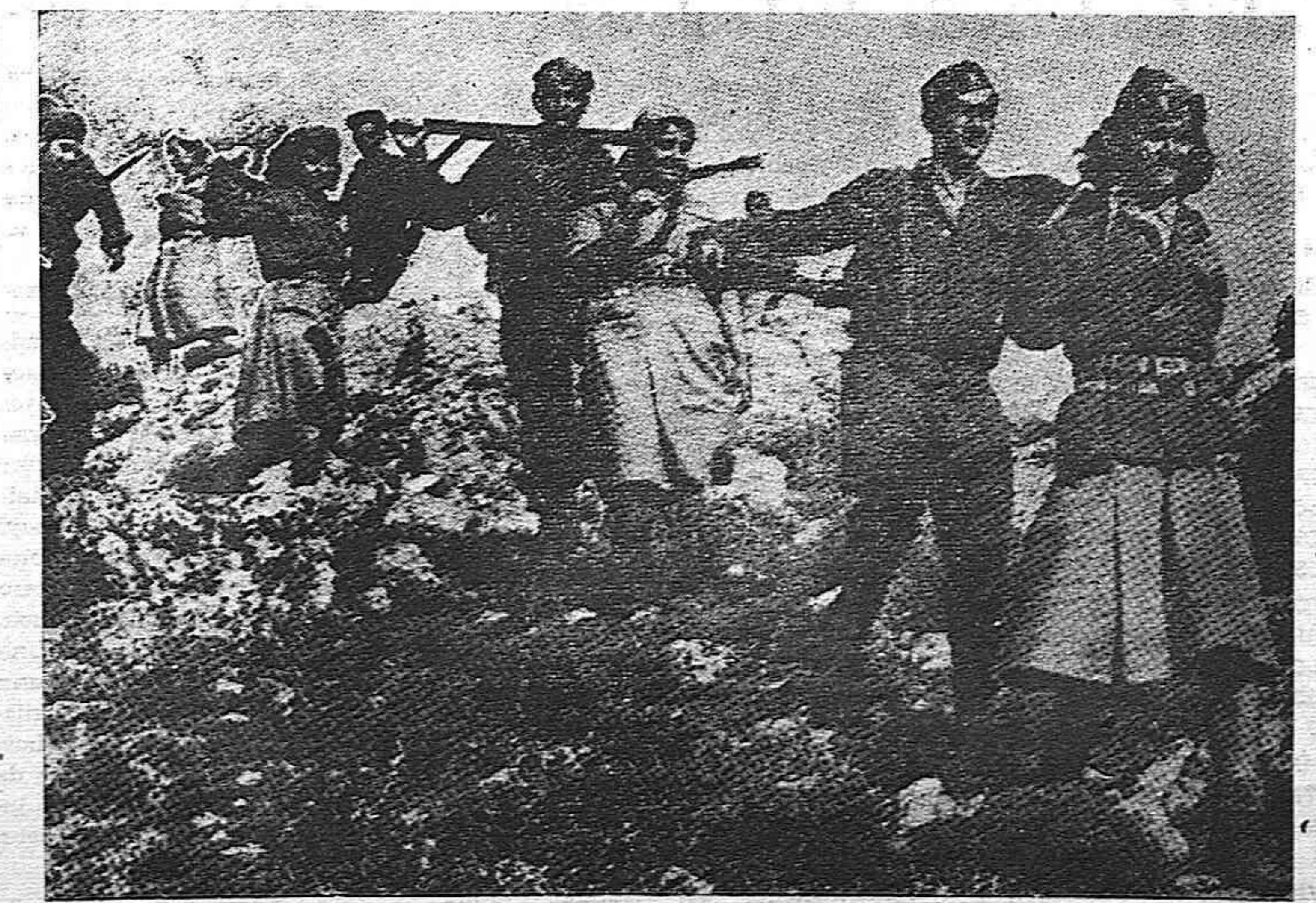
Guerrilleros griegos pertenecientes al Ejército de Liberación formado por los patriotas helenos.

dia. Pero ello tiene su explicación. Y la realidad es muy dolorosa, pero así es. En el último discurso de Indalecio Prieto, al tratar sobre el Congreso de Toulouse, sus acuerdos y participantes y hacer responsable de todo lo que allí se ha acordado al Partido Comunista de España poco menos que ha venido a coincidir con sus ataques a nuestro Partido y a nuestras militantes con los puntos de vista expuestos por Franco y Lequerica. Hace muy pocos días en una declaración de Franco, facilitada al director de los Servicios de la Unidad Press, dijo, acerca de la presencia de la División Azul en el frente ruso: "Esto no implicó idea de conquista ni pasión contra ningún país sino más bien un pro-