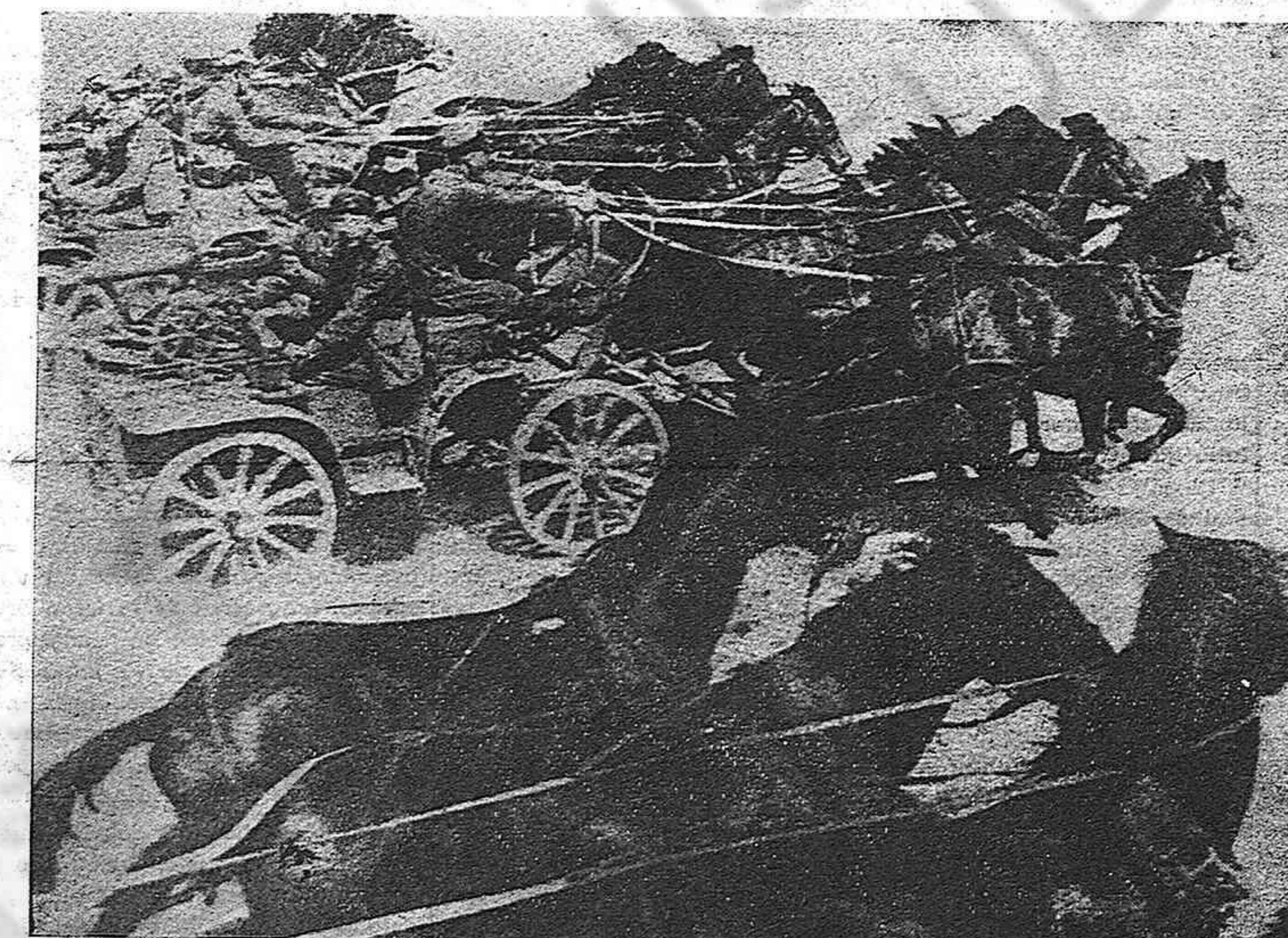
Caballos y arzones del Ejército Rojo