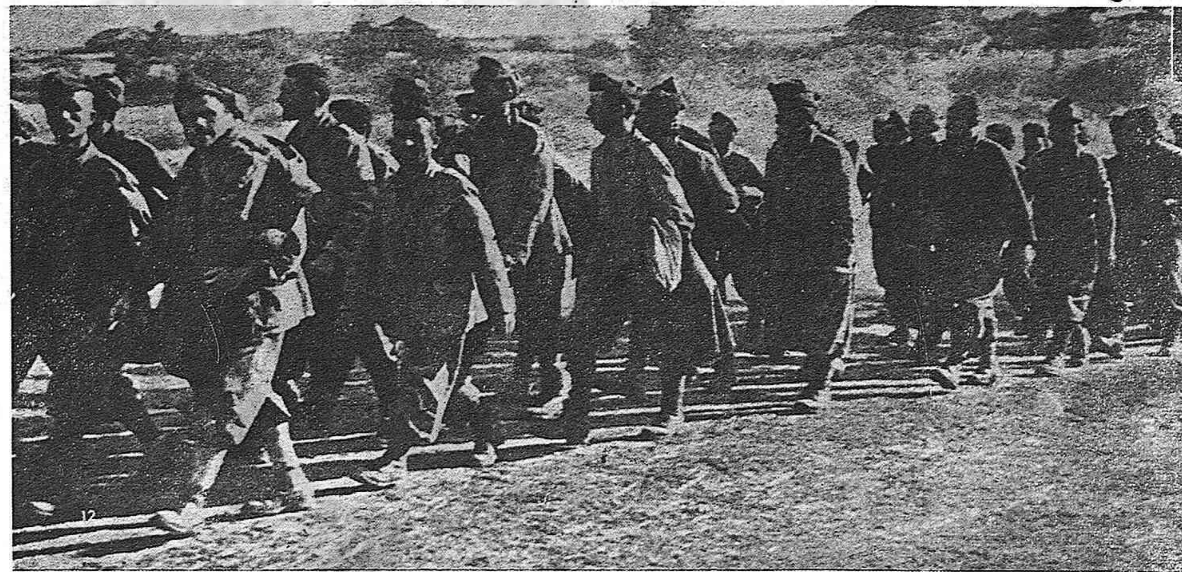
Nazis capturados en el frente italiano.

Muchas veces hemos hablado del largo tiempo que llevan en filas los soldados españoles, pero tal vez alguien no se dé perfecta cuenta de lo que esto significa para la juventud. Es algo más que la permanencia en el cuartel, con mala comida, y malos vestidos. Es algo más que el sufrir los malos tratos de los oficiales, más que el alejamiento de los familiares. Estos largos años que los jóvenes españoles se ven obligados a permanecer en el ejército, son la pérdida de su juventud. Son innumerables los casos de muchachos que fueron movilizados a los 18 años en el Ejército y no tienen esperanza de un licenciamiento inmediato. La mayoría de ellos, y son miles y miles, no habían terminado de aprender un oficio, ni mucho menos habían terminado otros, sus carreras, algunos ni las habían empezado. Durante todos estos años han visto pasar los días perdiendo su tiempo dentro de los cuarteles y sin posibilidad de prepararse para hacer frente a las necesidades de la vida. Esto es lo que Franco ha dado a la juventud. Los que entraron casi niños en el Ejército saldrán de él, sin un oficio, sin una carrera, sin poder trabajar. Y el pueblo español, en el día próximo en que se libere para siempre del régimen franquista, tendrá que atender al problema de la educación rápida de estos jóvenes para hacerlos útiles y asegurar su cooperación indispensable en el futuro bienestar de España.