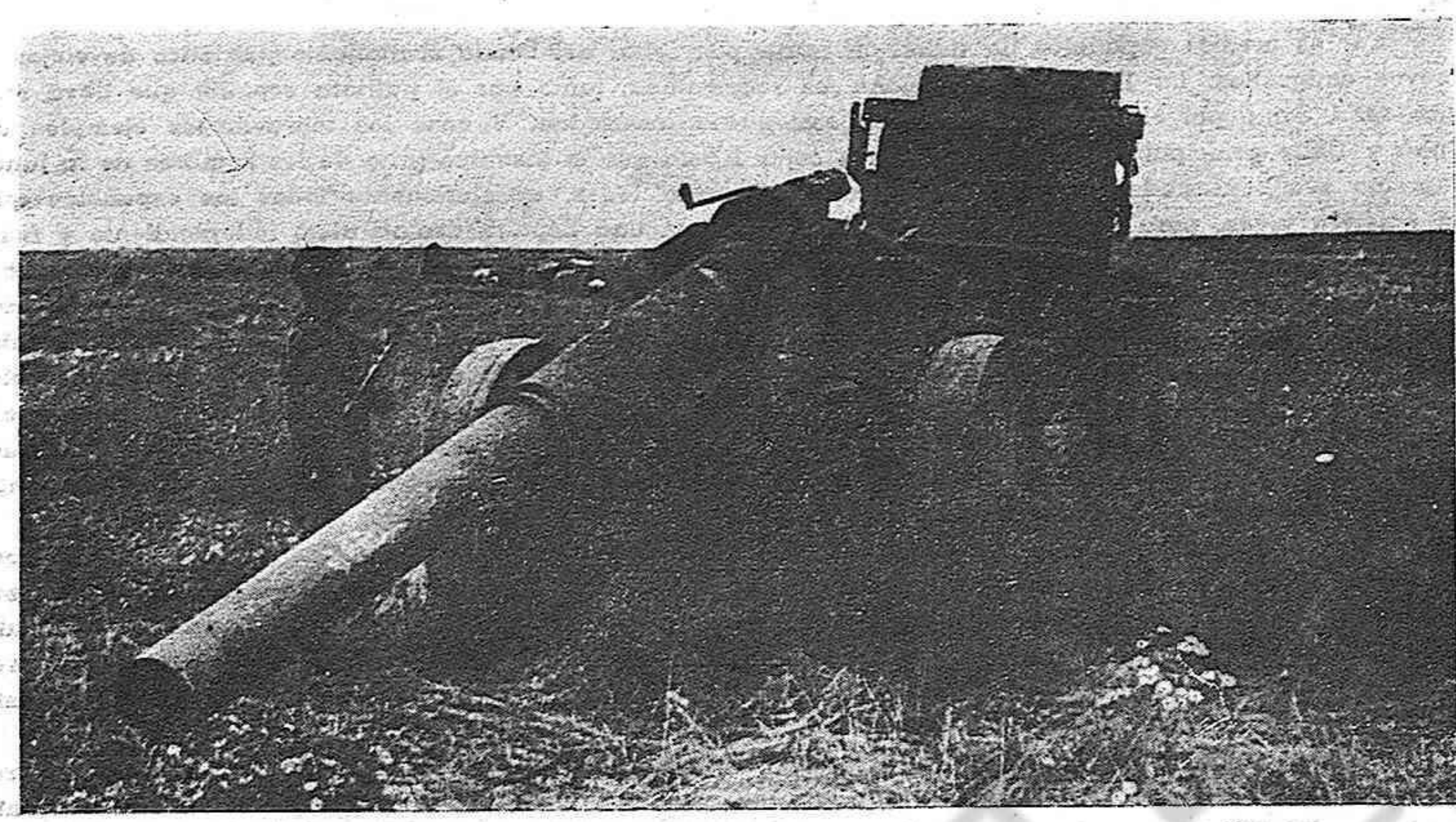
Material capturado a los nazis en el frente oriental.