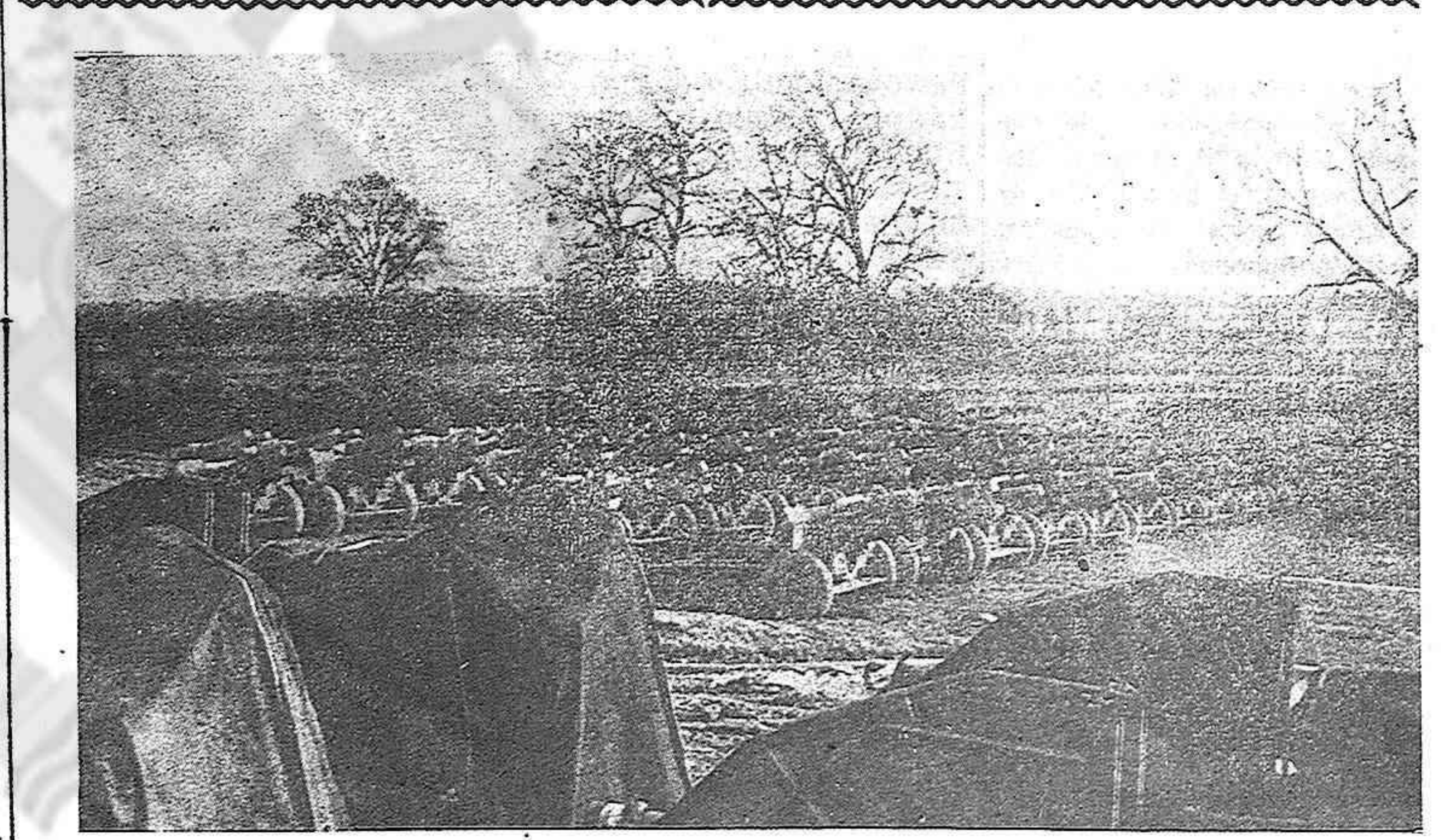
Cañones y más cañones que vomitán metralla contra los nazis en el Frente Oriental.

—Se llevan a los presos a un penal del norte. Entre ellos va su pariente. Ya están en la estación. La anciana señora corrió a la estación. Todo estaba a oscuras y en silencio. Un empleado compadecido le indicó dónde podría encontrar el tren de los presos. Estaba allá lejos, en una vía muerta, ante el depósito de mercancías. Allí fué la señora. Cayó muchas veces, porque la estación no tenía luz alguna, y tuvo que atravesar muchos andenes y muchas vías. Al final llegó. Apenas se divisaban los hombres. Se trataba de un tren de ganado. Los vagones no tenían puertas, sino un enrejado por donde penetraba el frío terrible de la noche, una noche gélida del mes de enero de 1942. No sabía la mujer qué hacer. Al fin se puso a gritar el nombre de su pariente. La respuesta siempre