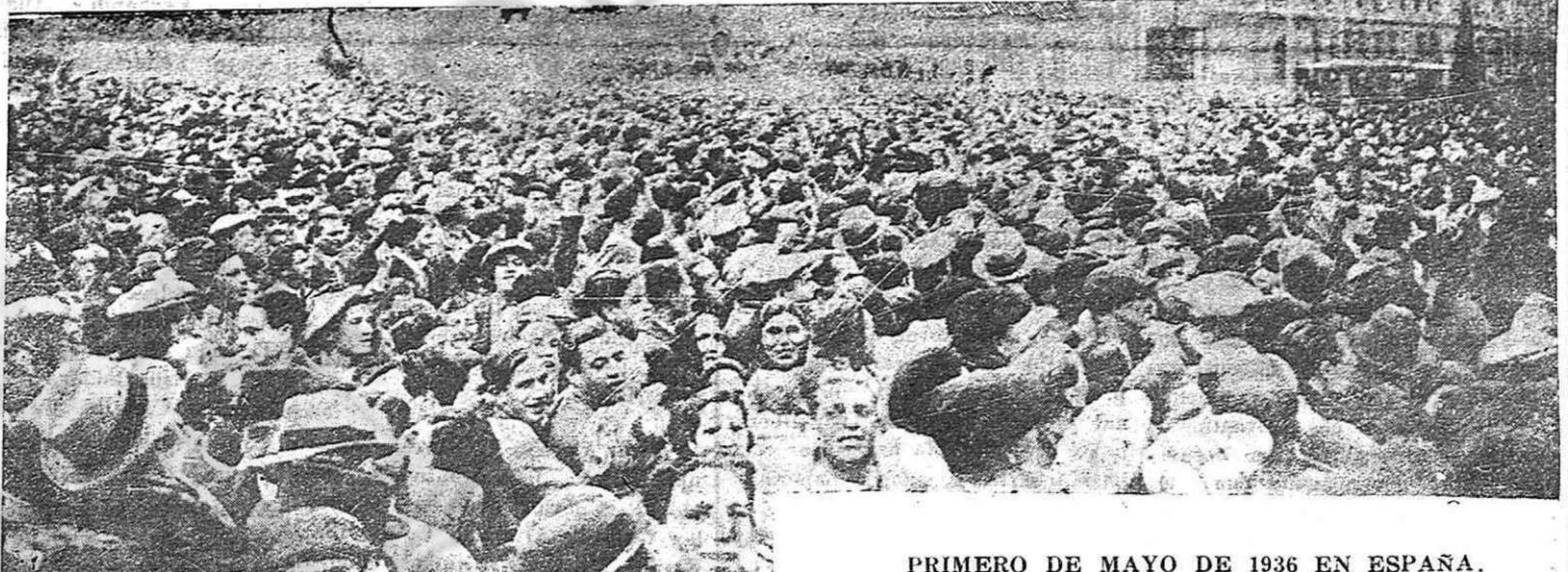
PRIMERO DE MAYO DE 1936 EN ESPAÑA.

Nos hemos impuesto la tarea constituya un deber de primer de ayudar a "España Popular", orden para cuantos sientan estos problemas. A nuestro llamamiento han respondido muchos amigos enviándonos su ayuda. Esto es una demostración de que el periódico cuenta con grandes simpatías. Las sumas totales de lo recaudado hasta ahora por países, alcanzan: Estados Unidos de Norte-América: 264 dólares. Chile: 77 dólares. Argentina: 34.54 dólares. México: 500 pesos. (m. n.) Al mismo tiempo hay anuncios de cantidades que van a ser enviadas de Cuba, Colombia, Argentina y México. Estos resultados conseguidos con mínimo esfuerzo indican que hay muchas posibilidades que deben ser aprovechadas en el sentido de la ayuda a "España Popular". Quienes estamos al frente del Patronato de "España Popular" nos consideramos en la obligación de dirigirnos nuevamente a los que estimulan nuestras campañas, a los que alentamos a seguir por la vía de la intranquencia de la lucha contra el franquismo y por la República Popular española, a todos los amigos y simpatizantes, a cuantos nos tienen ofrecido su apoyo y pedir de ellos las aportaciones necesarias para cubrir lo que nos hemos propuesto en cuanto a recaudar los 2,000 dólares, con el fin de asegurar los recursos económicos durante el presente año a "España Popular". Presidente: Antonio Mije. Secretario: José Ignacio Mantecón.