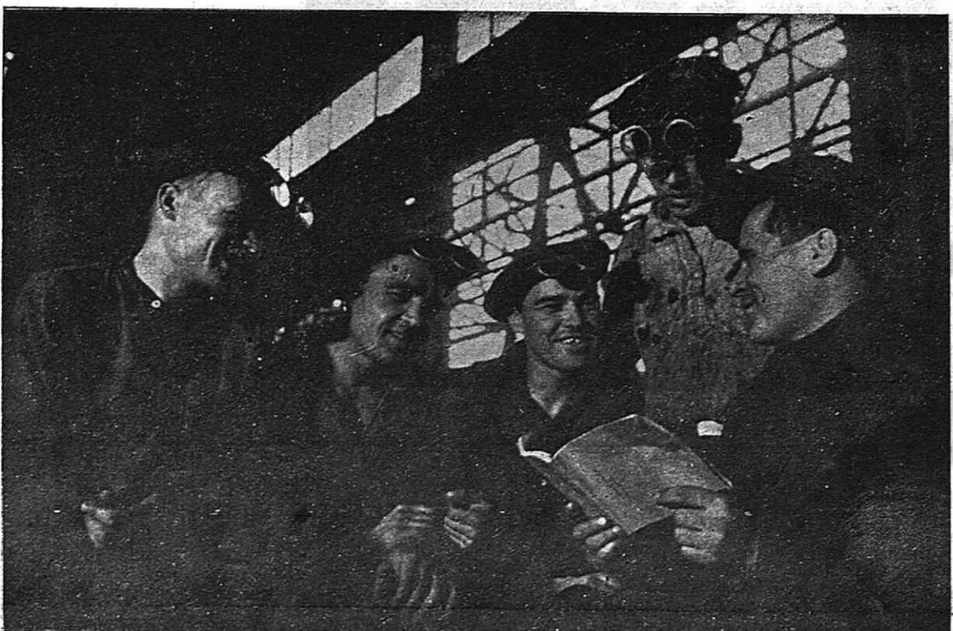
En la emulación socialista y en el movimiento stajonavista, los obreros dan prueba de una productividad de trabajo, que abre el camino al paso del socialismo al comunismo, y que elimina las contradicciones entre el trabajo intelectual y el trabajo manual. EN LA FOTO: Los fundidores de acero del combinado metalúrgico de Magnitogorsk, durante el examen de una proposición para la emulación socialista.