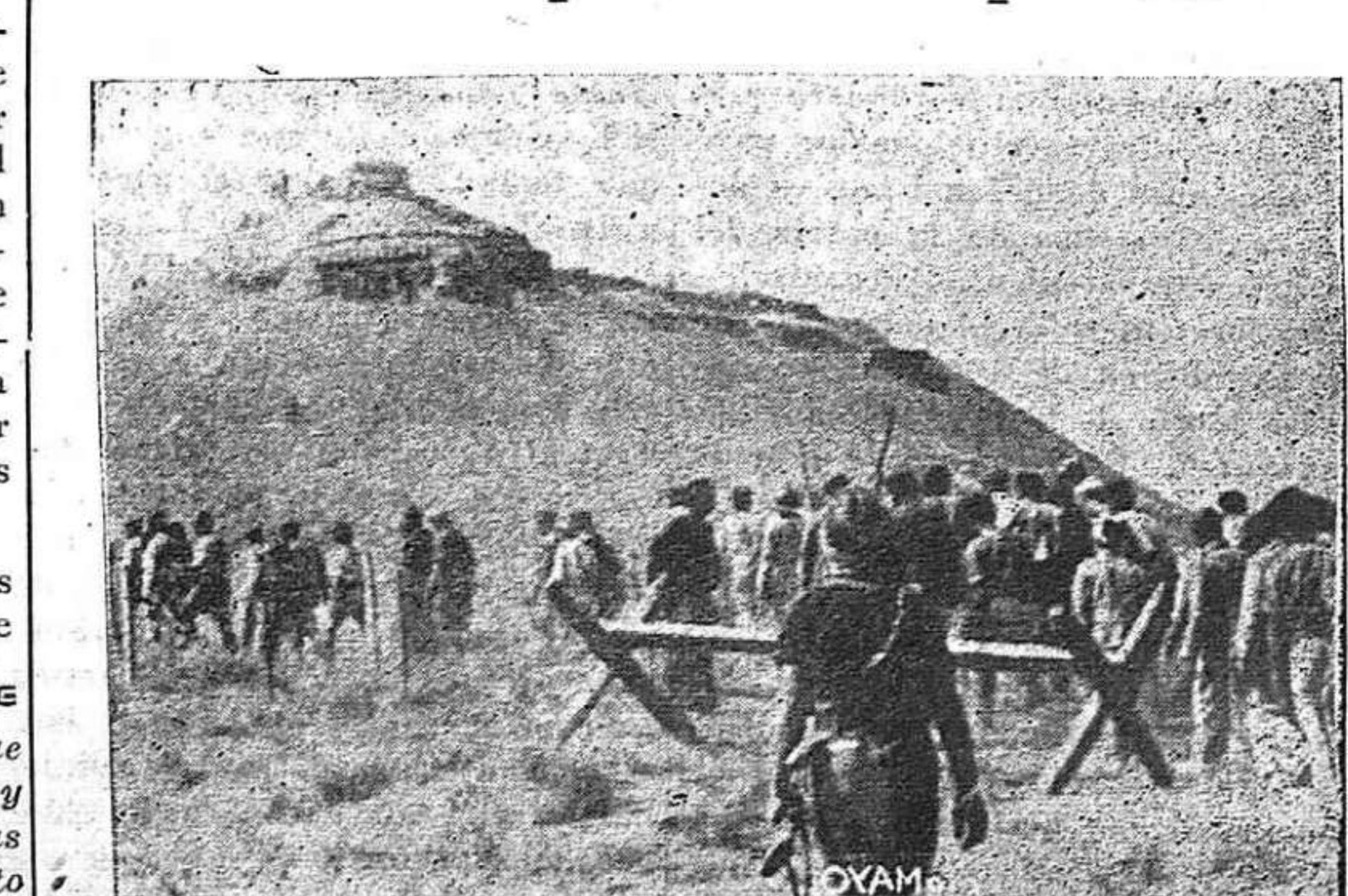
En la operación de Belchite hubo sorpresa, audacia, organización y heroísmo a raudales. (Véase nuestra información en la página cinco)