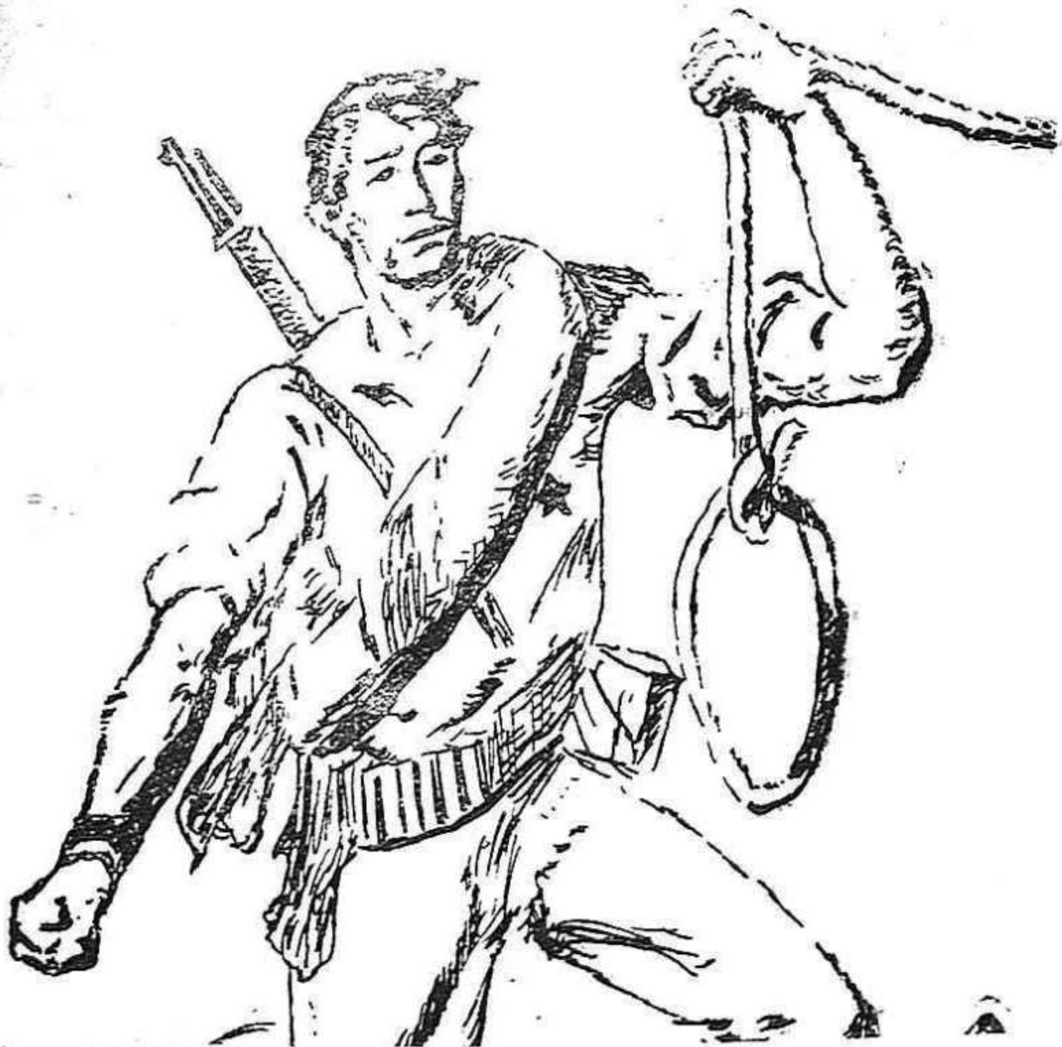
La suerte de Franco está decidida por el pueblo español

En Samá de Langreo un grupo de guerrilleros se tropezó con la Guardia Civil con la que sostuvo un nutrido tiroteo, que terminó con la retirada de los guardias que tuvieron que cargar con dos heridos graves que les ocasionaron las fuerzas patriotas.