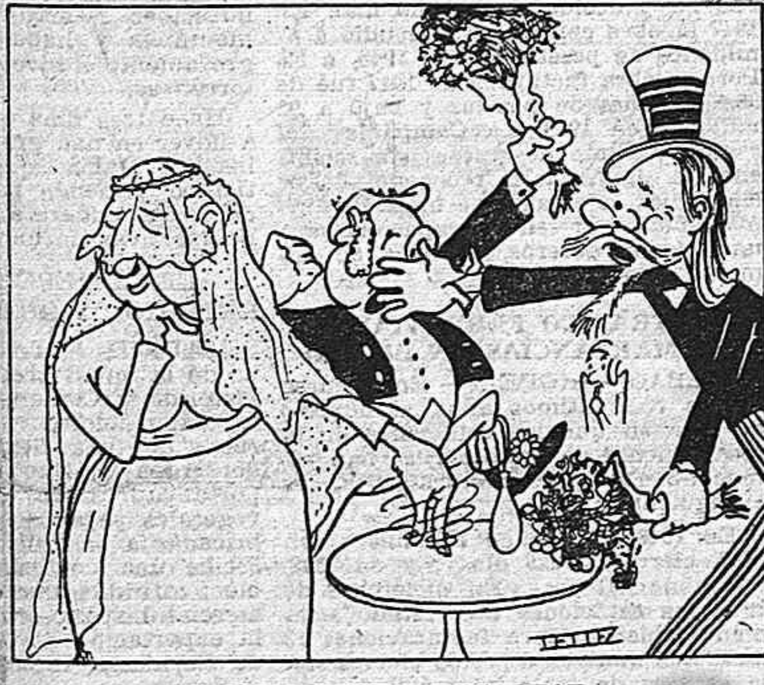
Y COMO PUEDE RESULTAR