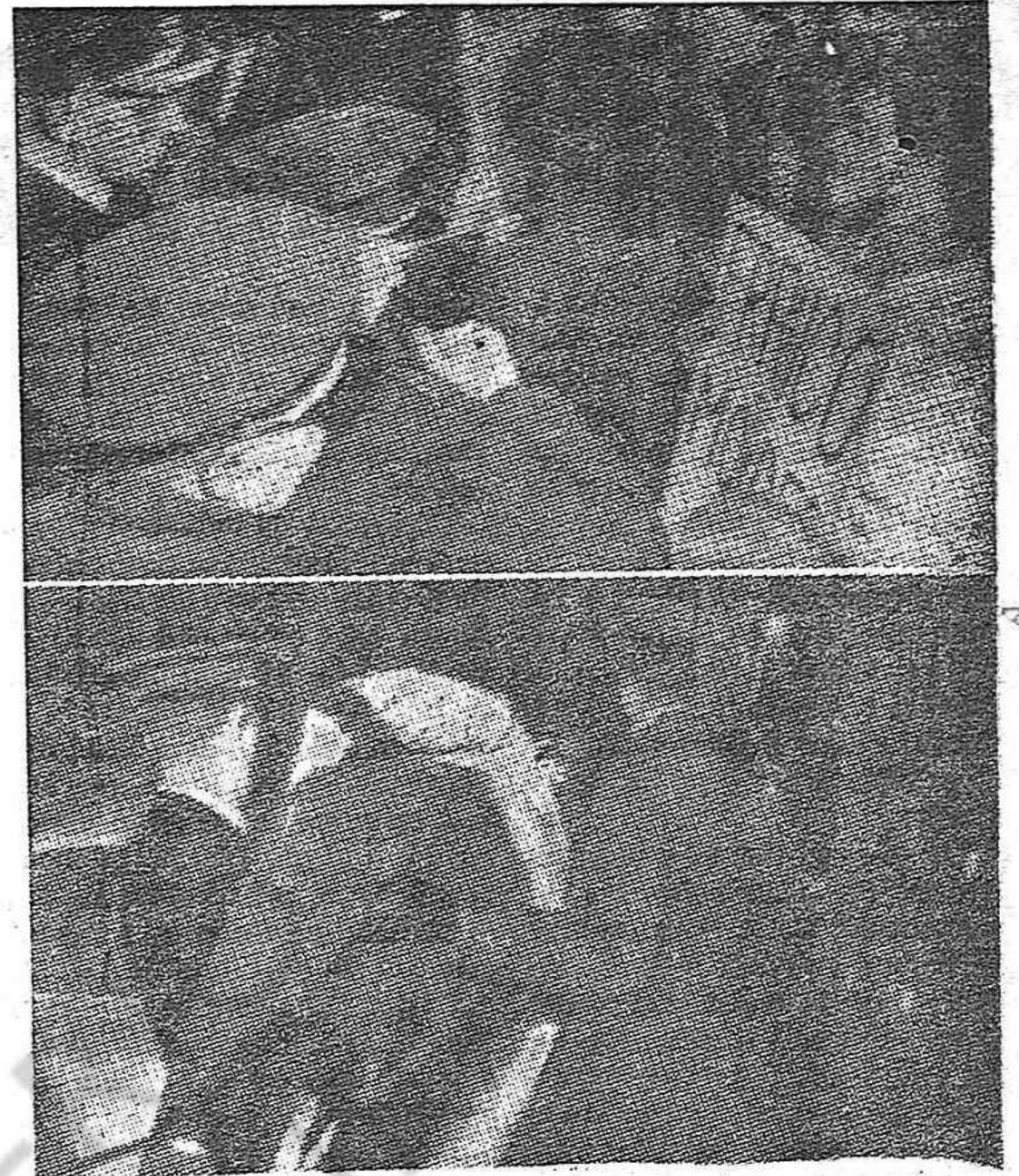
La composición gráfica nos ofrece dos aspectos de las manifestaciones registradas ante la Embajada española en Copenhague.

COPENHAGUE. 24 de noviembre (ED).—Las manifes-