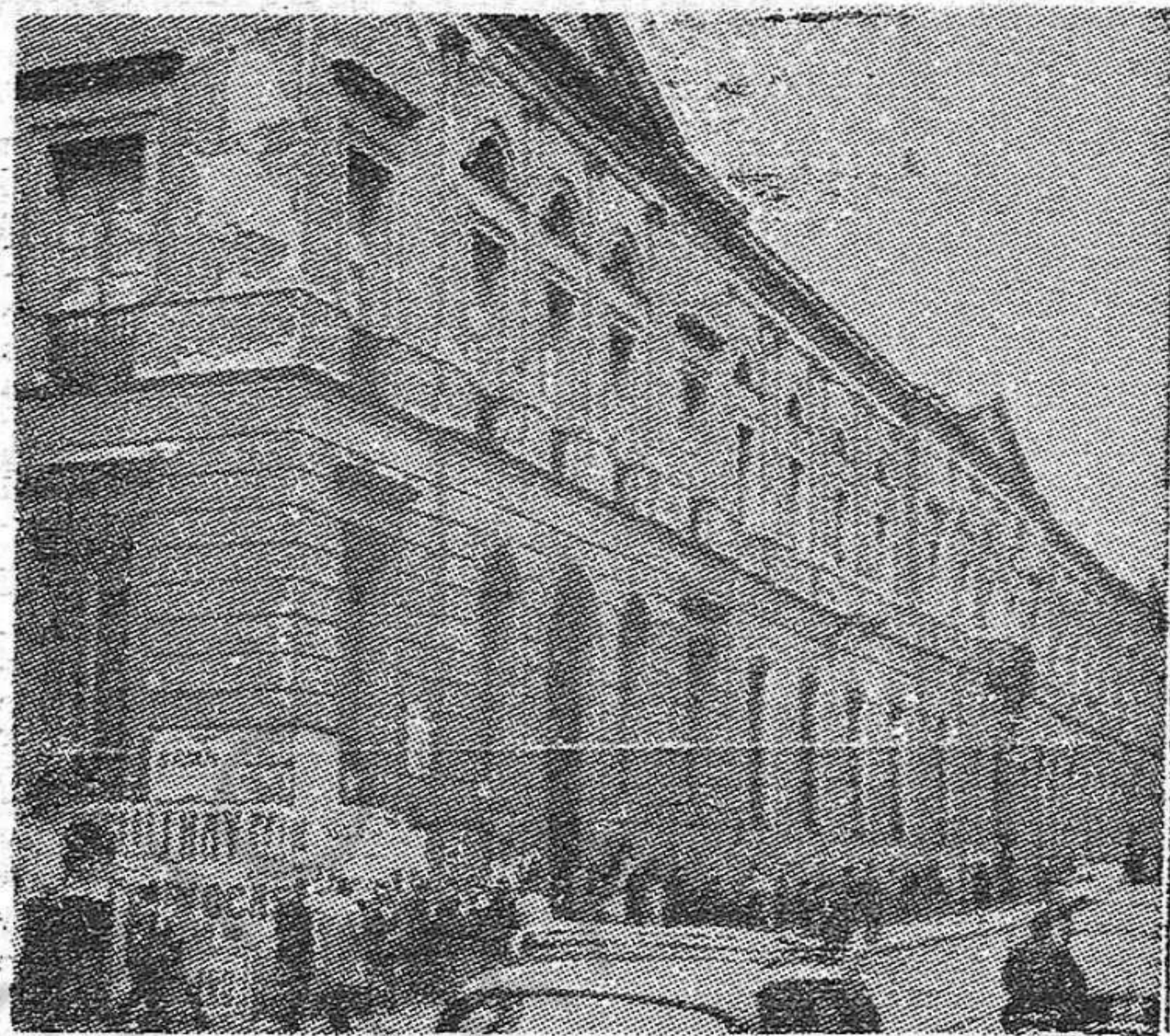
El viejo edificio de la Universidad, en la calle de San Bernardo de Madrid, donde aún se alberga la Facultad de Ciencias Políticas, Económicas y Comerciales, que tuvo siete mil alumnos el año pasado.

Pero ¿y el aumento de sueldo? ¿Es qué pretenden los apologistas del régimen y los defensores del Plan de Desarrollo que un profesor viva con 22.656 pesetas anuales y con 15.160 en muchísimos casos? (Cifras publicadas por el "Bo-