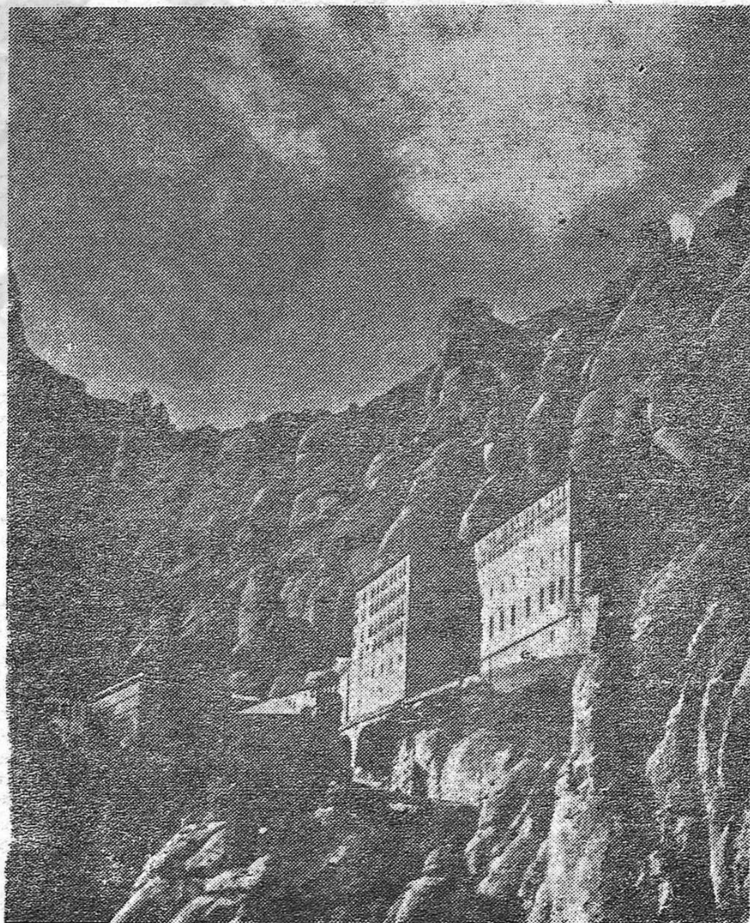
El Monasterio de Montserrat.

En su Declaración de junio, nuestro Partido no sólo ha valorado la importancia de la acción del movimiento nacional democrático en el actual cuadro de la lucha antifranquista; no solamente se dice que: "la transformación democrática exige la constatación del carácter multinacional de nuestro Estado, el pleno reconocimiento de los derechos nacionales y concretamente, del derecho de autodeterminación de los pueblos de Cataluña, Euzkadi y Galicia", sino que se ha esforzado por dar a ese problema una cierta concreción en el orden económico, político y cultural. Pero esa concreción será aún mayor —y es necesario que lo sea— si los comunistas catalanes, vascos y gallegos contribuyen más a ello con su estudio, investigación y análisis de la realidad económico-social y cultural de cada una de esas nacionalidades (al unísono con el propio desarrollo de la lucha general de la clase obrera y de las masas) y de la acción nacional democrática. Esta deberá atraer cada vez más una parte importante de su atención y tener todo su estímulo y apoyo.