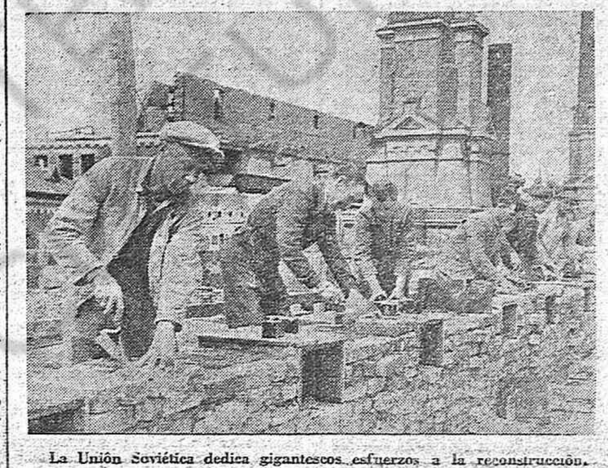
La Unión Soviética dedica gigantescos esfuerzos a la reconstrucción.

EL ministro soviético de Comunicaciones ha declarado que los transportes de viajeros por ferrocarril han superado la cifra de antes de la guerra. CONTINUAN realizándose en la Unión de Repúblicas Socialistas Soviéticas grandes trabajos para la construcción de alojamientos.