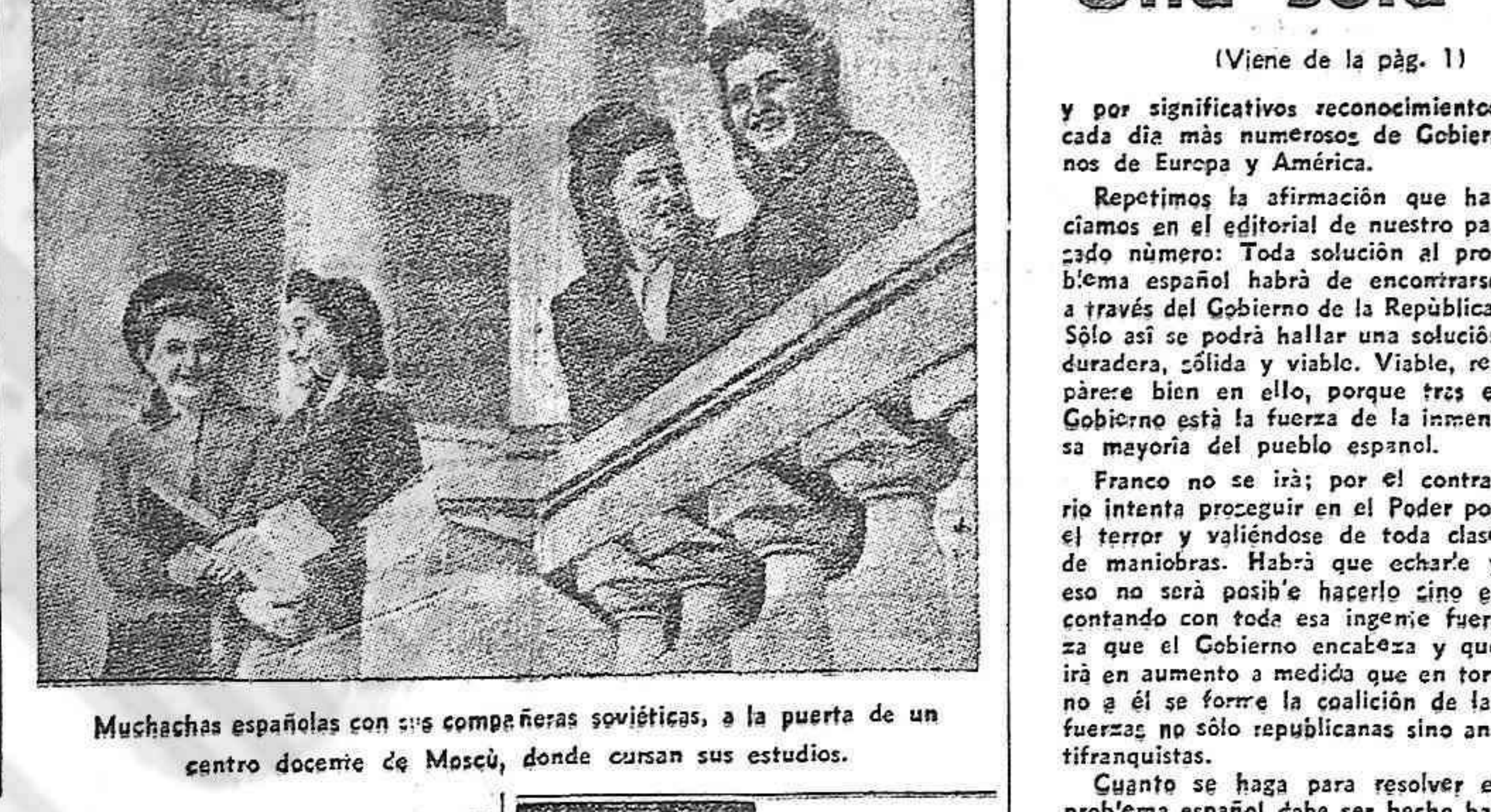
Muchachas españolas con sus compañeras soviéticas, a la puerta de un centro docente de Moscú, donde cursan sus estudios.

(Viene de la pág. 1) comán, dentro y fuera de España, contra el régimen franquista, para fortalecer al Gobierno de la República, para asegurar una salida democrática a la situación política actual en nuestra patria. Hemos subrayado además que la unidad de socialistas y comunistas sería un gran estímulo para fortalecer la ayuda internacional hacia el pueblo español, ya que los Partidos Socialistas y Comunistas son las fuerzas más importantes en la mayoría de los Gobiernos de los países de Europa.