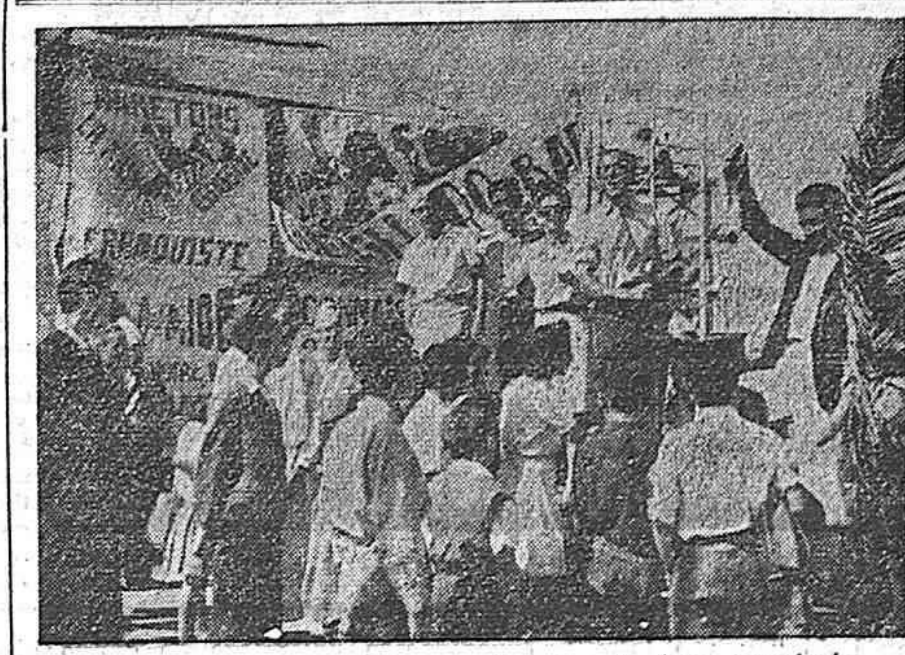
La tómbola de los comunistas españoles en la fiesta organizada por el 'Avenir', órgano del Partido Comunista Tuncino.

Los obreros de la fábrica de hilados y tejidos Hijos de F. Sans, en Barcelona, declararon en los primeros días de febrero una huelga de brazos caídos pidiendo aumento de salarios y mejor racionamiento.