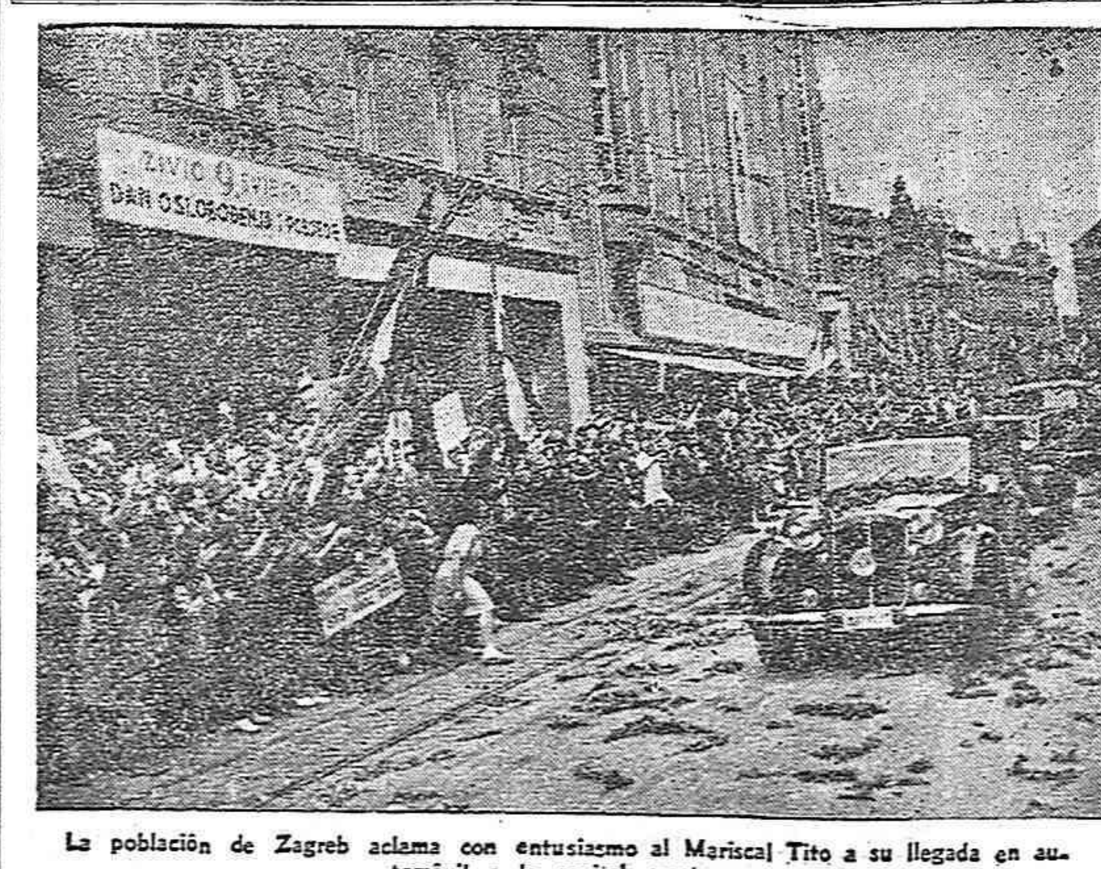
La población de Zagreb aclama con entusiasmo al Mariscal Tito a su llegada en automóvil a la capital croata.

En la página 4. Información y comentario sobre las elecciones en Italia. "La República y la unidad nacional", artículo original de PALMIRO TOGLIATTI.