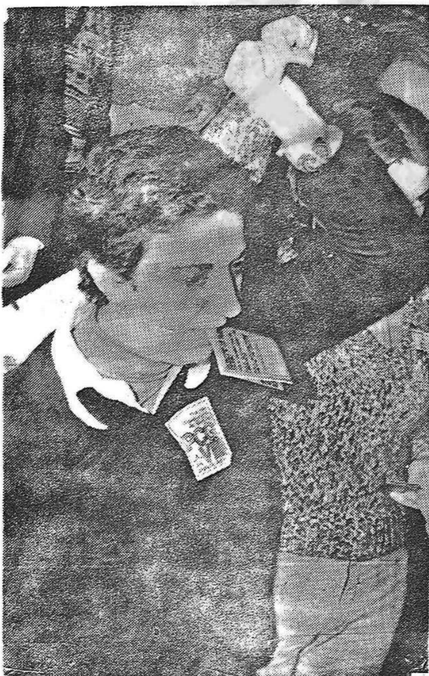
A VOZ DO POBO