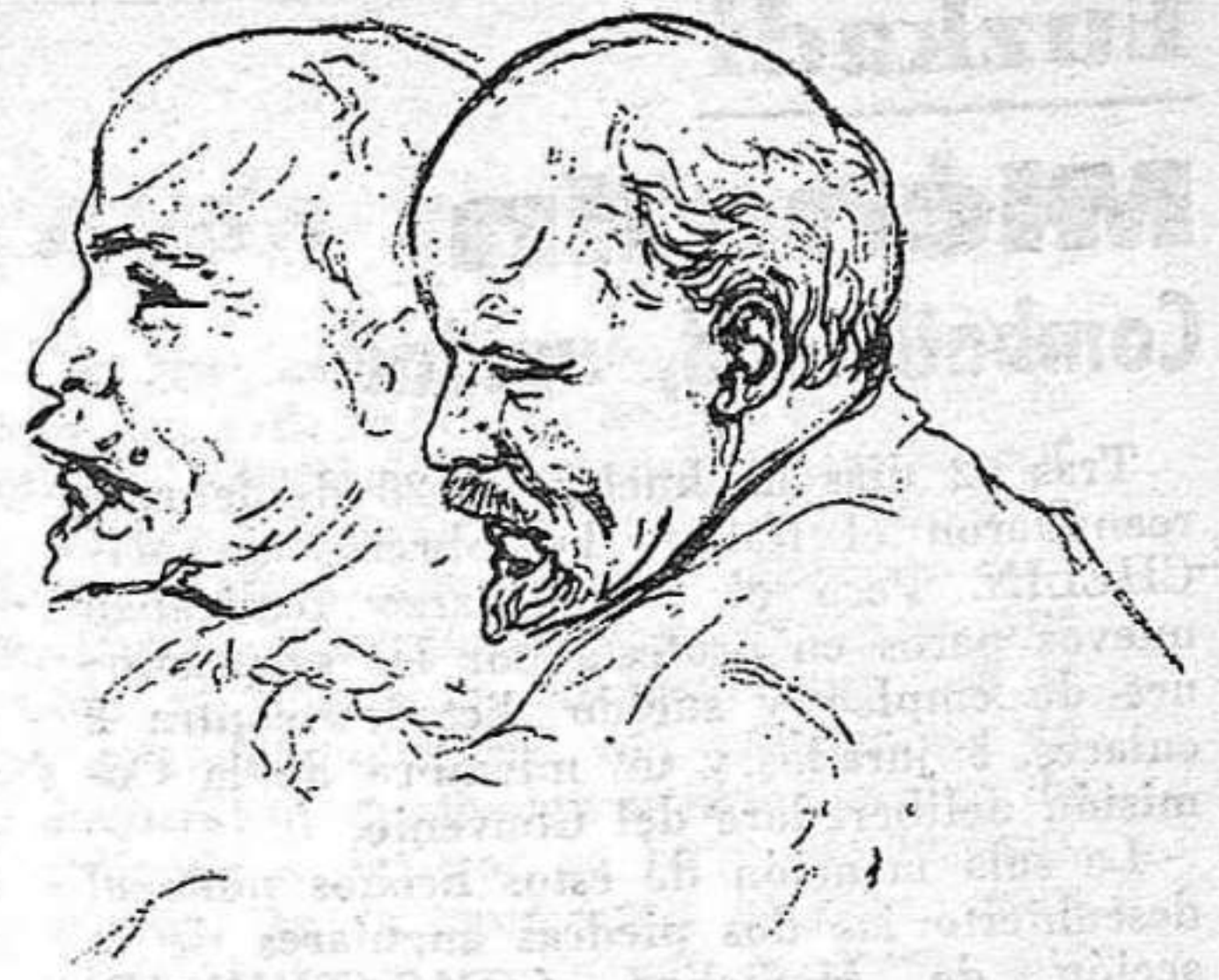
Comunista en la defensa de sus intereses de clase y de sus ideales revolucionarios.

L A unidad de los que se consideran sinceramente marxistas leninistas, de todos los socialistas revolucionarios en las filas de nuestro Partido se hará cada vez más sobre el esclarecimiento y comprensión de la compleja y concreta estrategia de la lucha por el socialismo en nuestro país. Mientras tanto, en la polémica con los que discrepan con nosotros, los comunistas nos imponemos una norma: la defensa y explicación infatigable y firme de nuestras posiciones, junto con la buena fe al juzgar las actitudes de nuestros oponentes, y el respeto hacia la honestidad —mientras no se demuestre lo contrario— de sus posiciones, incluso cuando las criticamos por erróneas. Nos gustaría que se nos tratase de la misma forma. Que se eliminaran los insultos procaces, las falsificaciones maniqueístas de nuestras actitudes, la calumnia que tanto usan hoy algunos para combatirnos, la saña personal. Esos métodos de polémica no son revolucionarios, recuerdan demasiado las formas en que nos combaten los fascistas y repugnan a las masas trabajadoras que reconocen la firmeza, la consecuencia y el sacrificio del Partido