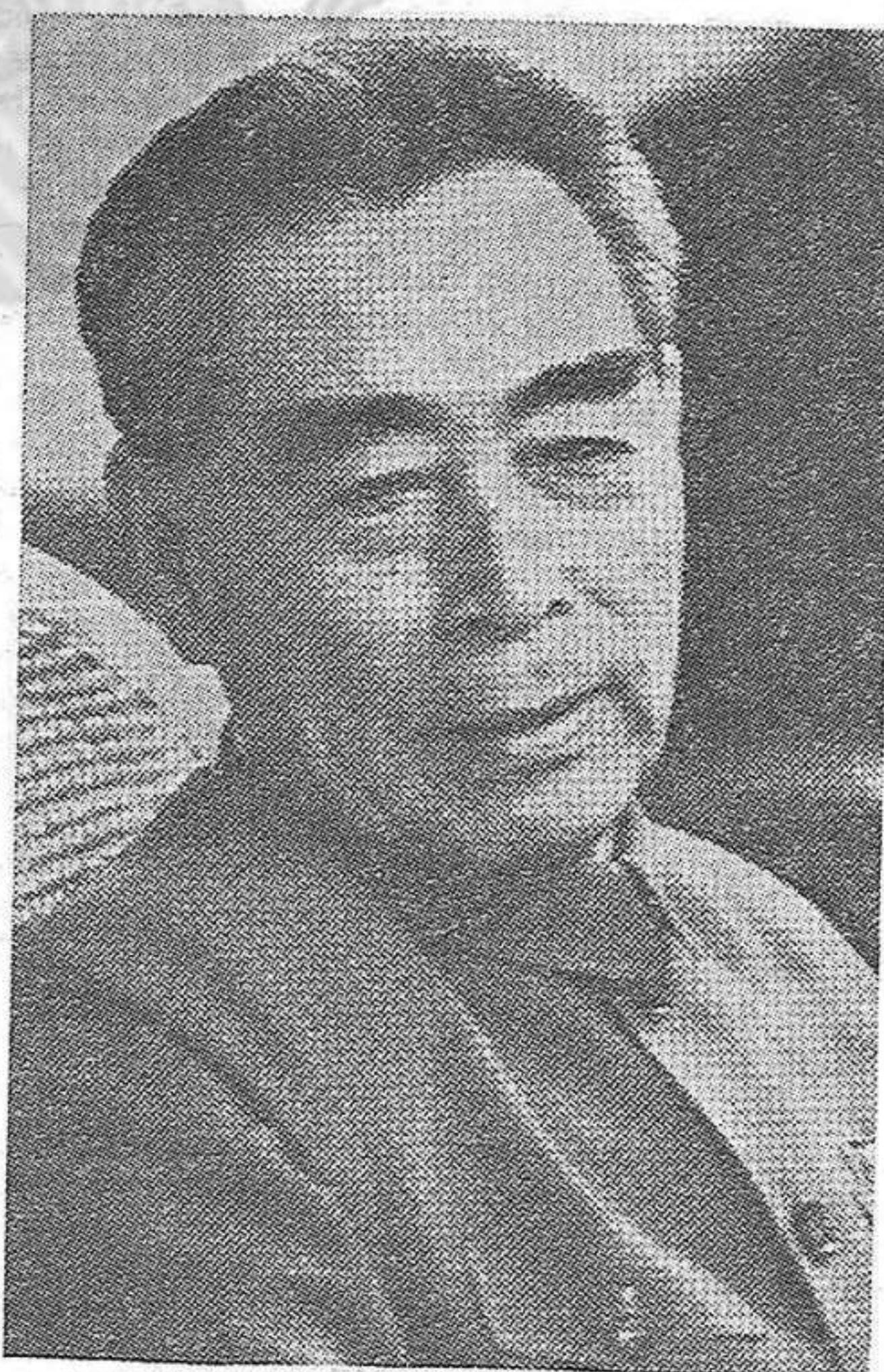
CHU EN LAI

Y lo mismo que nos alegramos y que luchamos por que la U.R.S.S. fuese reconocida, en tanto que comunistas no podemos