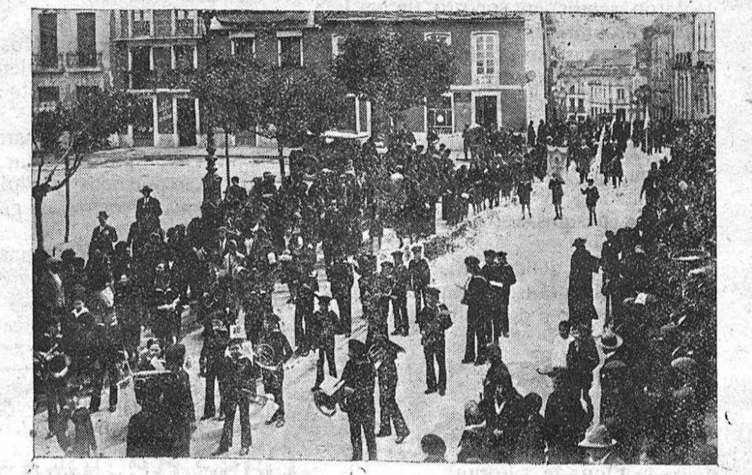
OTRA NOTA DE LA MISMA SOLEMNIDAD.—PASO DE LA PEREGRINACIÓN CORUNESA POR LA PLAZA DE SANTO DOMINGO. EN PRIMER TÉRMINO LA BANDA DE MÚSICA DE LAS ESCUELAS LABACA, DE LA VECINA CIUDAD

Mientras que casi todos los tratados similares hasta ahora publicados responden a las necesidades didácticas, o sea que son propios para profesionales y resultan, por tanto, de escasa eficiencia en la tarea de enjuiciar con intención divulgadora las verdaderas características del arte arquitectónico en función del tiempo y del espacio, la obra de Fletcher constituye, como su título indica—«Historia de la Arquitectura por el método comparado»—el compendio que tanto se echaba de me-