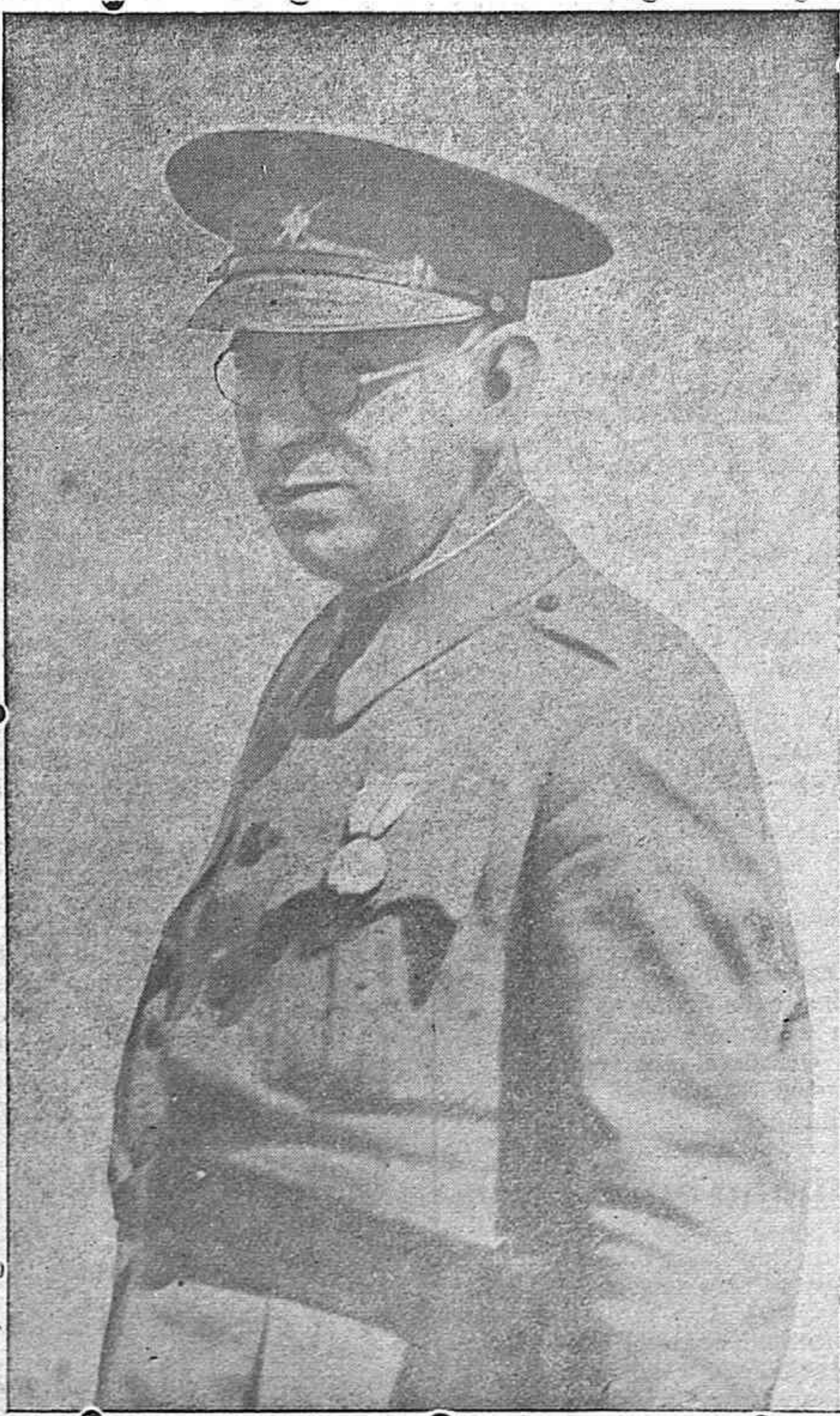
General D. Emilio Mola: ¡Presente!

Español: Saluda siempre con la mano en alto. Cada vez que así saludas confiesas tu amor a España, tu fe en el nuevo Estado, tu adhesión al Caudillo, la firmeza de tu convicción de que nuestra Patria es ya Una, Grande y Libre y ello de un modo categóricamente definitivo