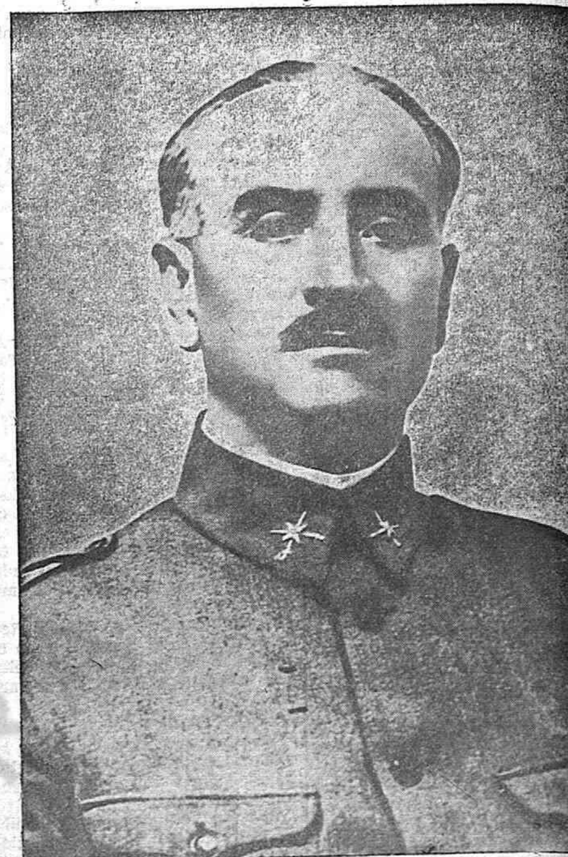
General D. Gonzalo Queipo de Llano

Por él se concede el derecho al trabajo a los prisioneros de guerra presos por delitos no comunes, por cuyo trabajo devengarán los jornales que se especifican, suficientes para subvenir a su propio manutención y a la de sus familias.