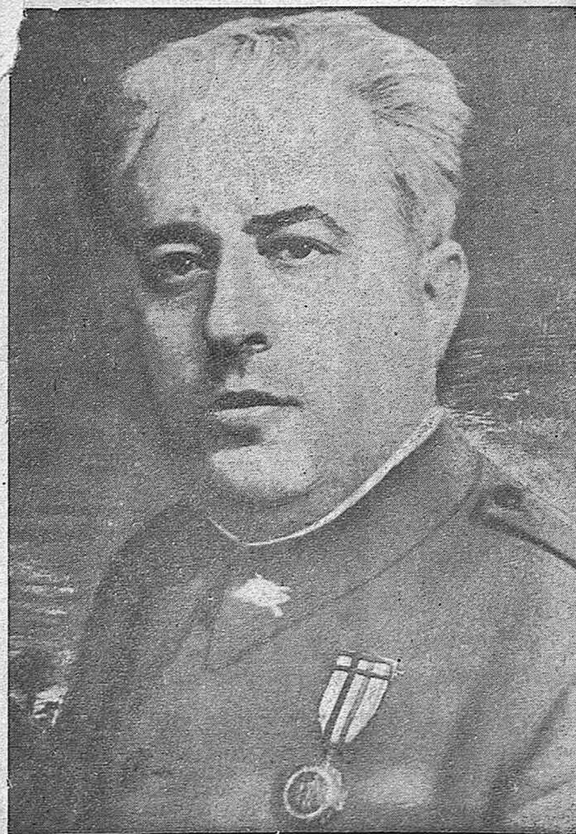
General D. Juan Yagüe

Español: Saluda siempre con la mano en alto