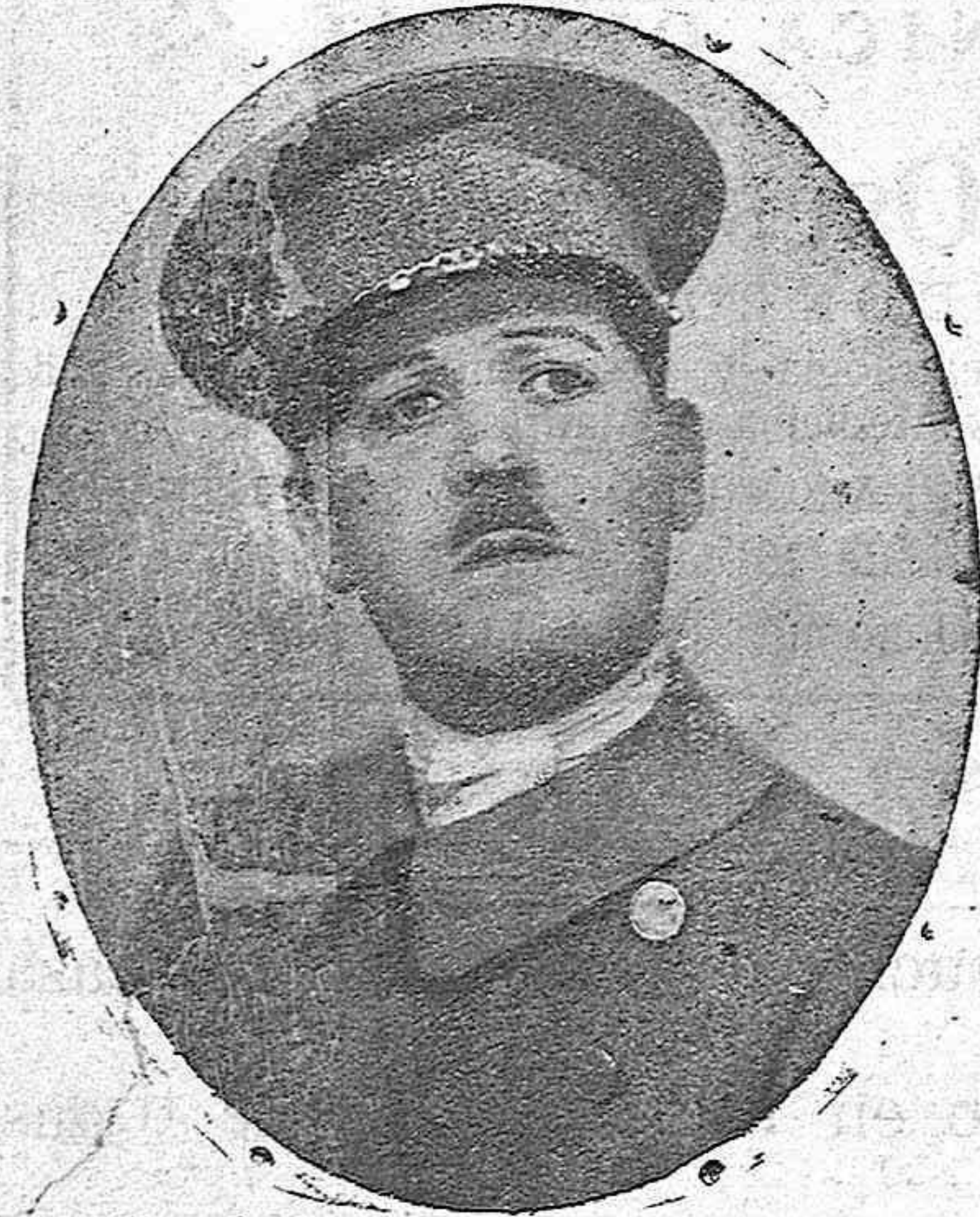
Albert Prejean en «El chófer de su mujer»

bajo la frondosidad de los árboles. Nunca se ha sabido poner en claro por qué la sombra del verde ramaje reblandece tanto corazón humano. Lo cierto es que, a los cuatro pasos dados en compañía del barón del Jazmín Florido comenzó doña Severina a rectificar la opinión que de los hombres tenía, y a comprender el trino de los pájaros en las ramas, el chirrido de los grillos en las eras y el maullido de los gatos en enero. Resultado de esta progresiva comprensión fué que sus entrevistas con el barón menudearon y que cada día escuchó con mayor satisfacción, con más ansiedad, el lenguaje hiperbólico del canoso don Tenorio, barón con b, y varón con v.