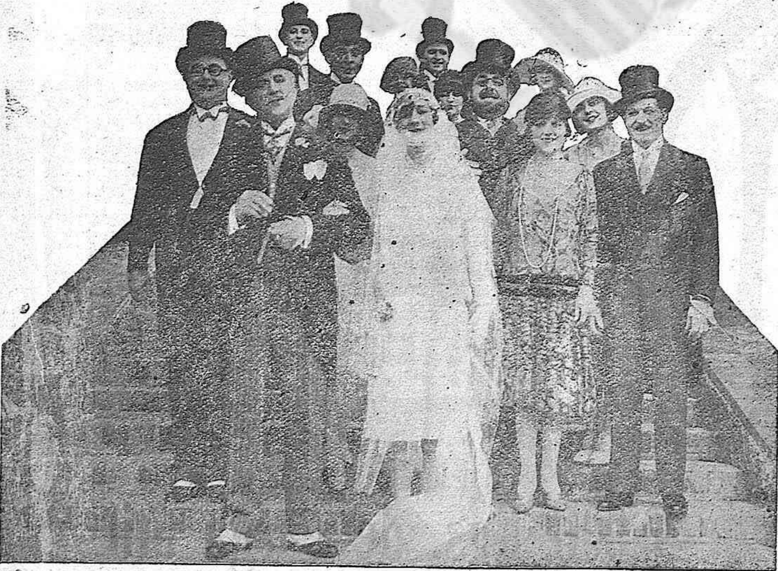
Una interesante escena de la película «El chófer de su mujer»

HOTEL DE VENTAS donde EN DOS MINUTOS y a precios baratísimos puede usted adquirir todo el mobiliario y cuanto necesite para su casa. HOTEL DE VENTAS Muebles nuevos. 34 ATOCHA 34. Muebles de ocasión Unica casa :: MADRID :: Entrada libre