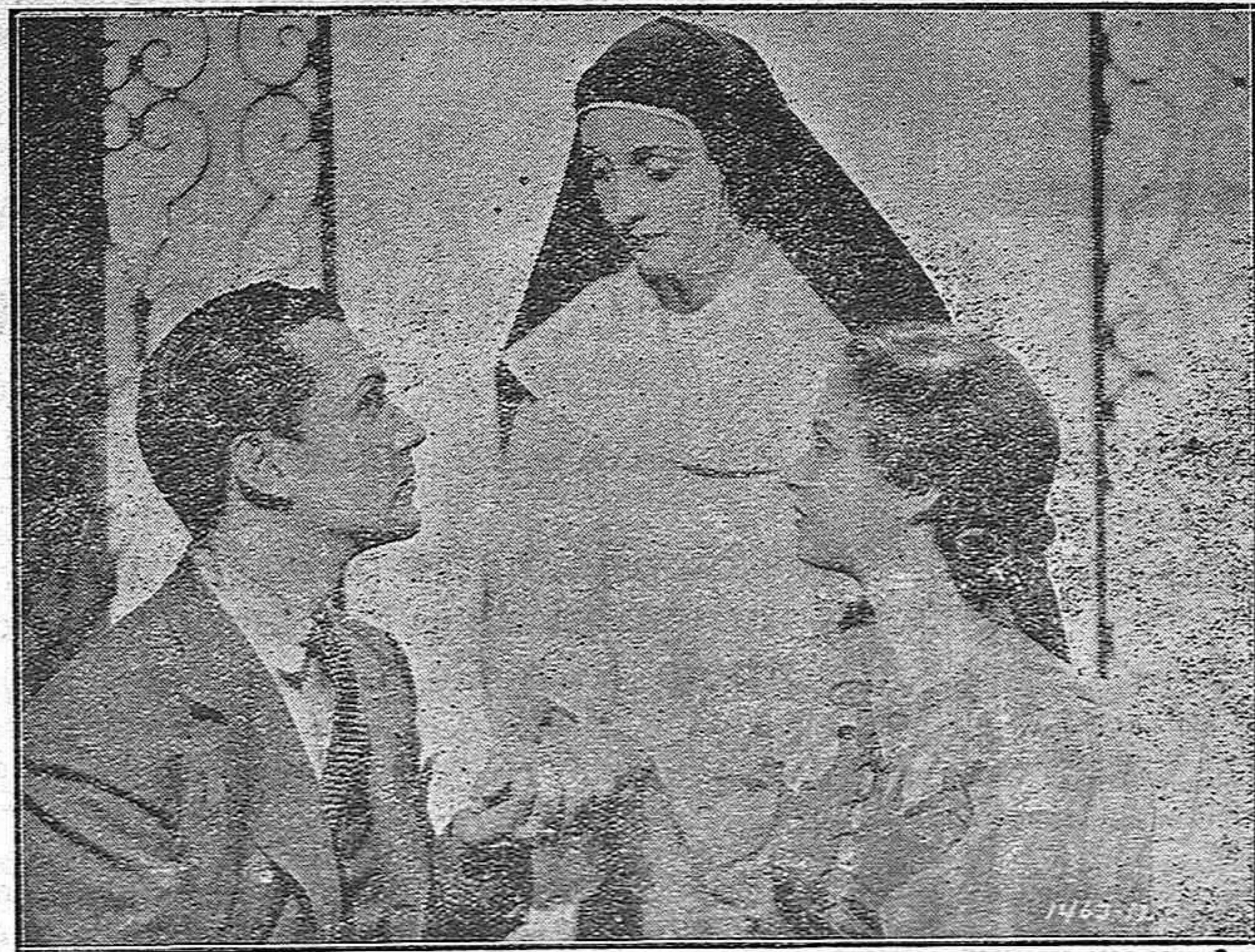
Dorotea Wieck, protagonista de «Muchachas de Uniforme» ha terminado una nueva película.

En nuestra fotografía podemos admirar a la famosa actriz, en su nuevo film «Canción de Cuna» en el que interpreta el papel principal de monja.