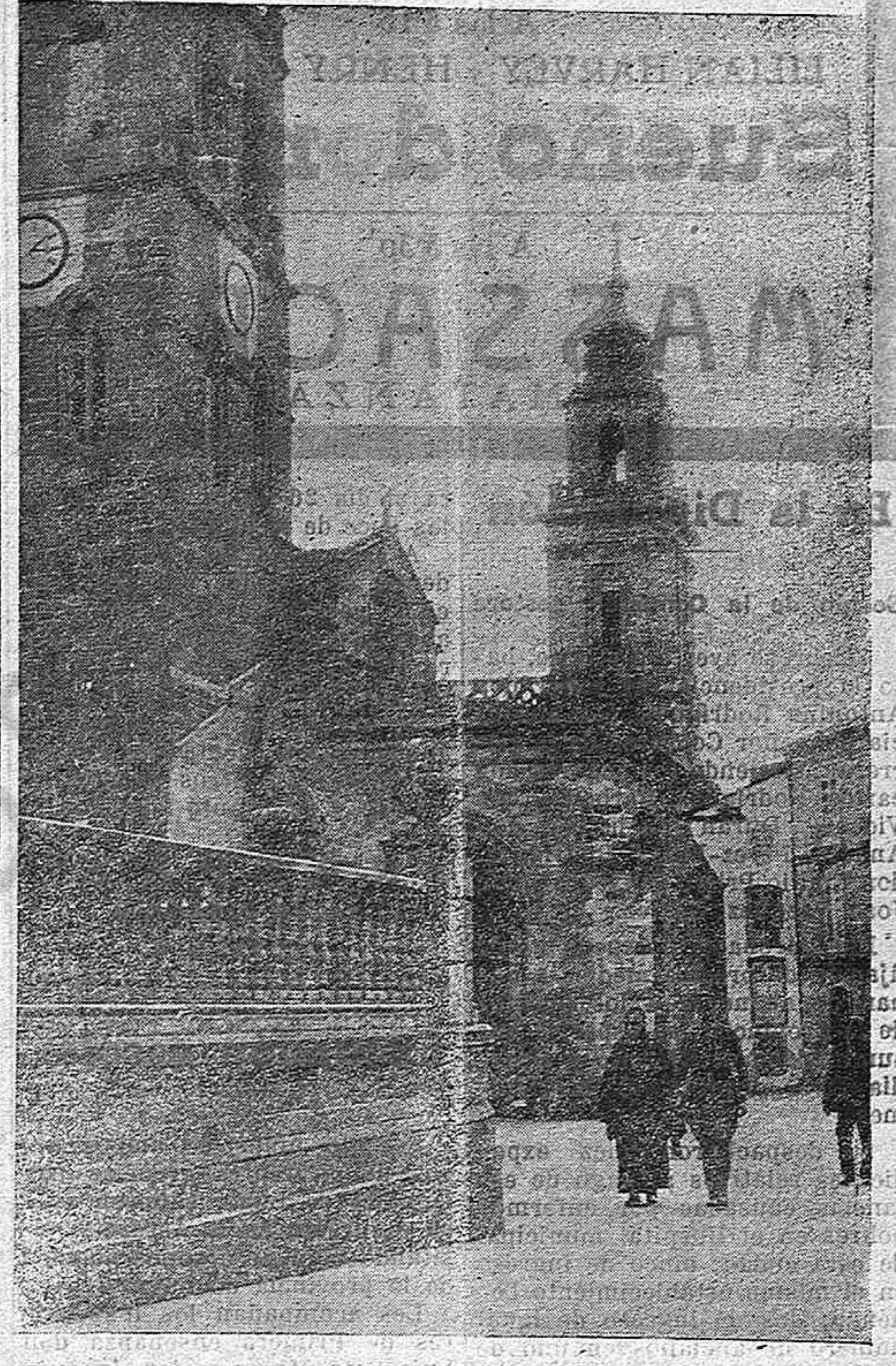
Vista parcial de la Catedral lucense. Plaza de Sta. Maria