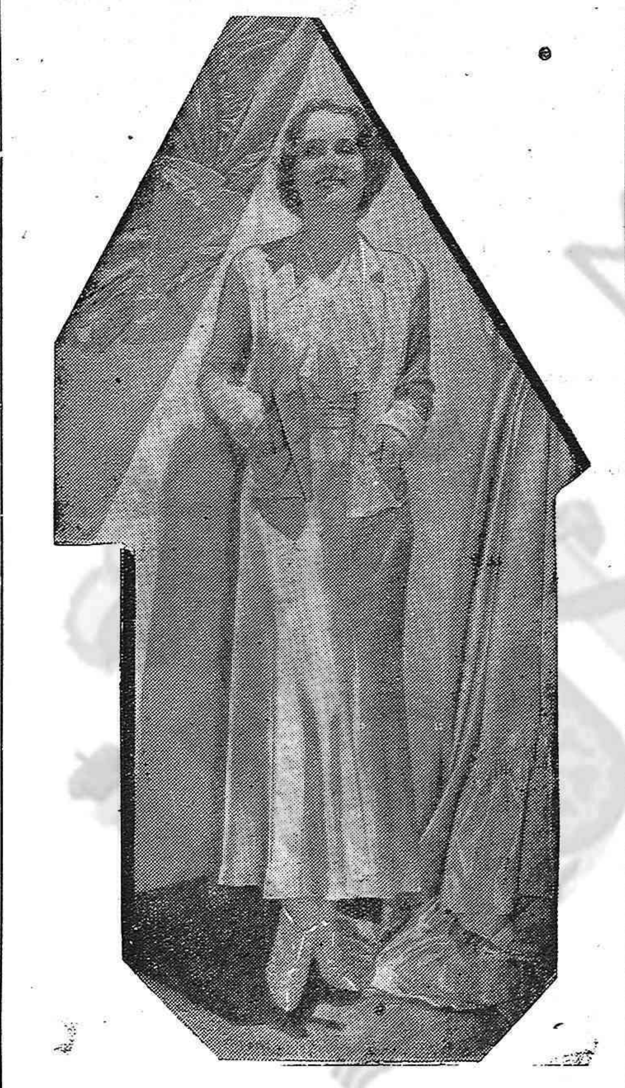
La actriz Norma Shearer que a su condición de notable y prestigiosa artista de la pantalla une la cualidad de ser admirada como modelo de elegancia y distinción social.

CASA YANEZ Líquida pijamas Majlotts y aiornoscos Frente al Banco de España