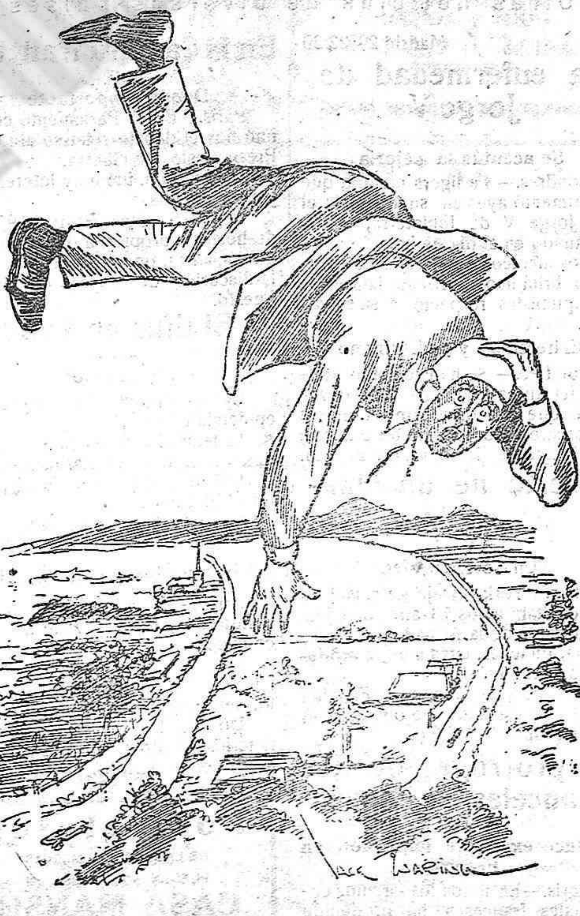
El aviador, incosciente, precipitándose en el vacío: —¡Socorro...! ¡Socorro...!

—El Ayuntamiento de Gijón ha concedido al Real Sporting un anticipo de 125.000 pesetas para el pago de las obras realizadas en su campo El Molinón, con motivo del partido contra Italia.