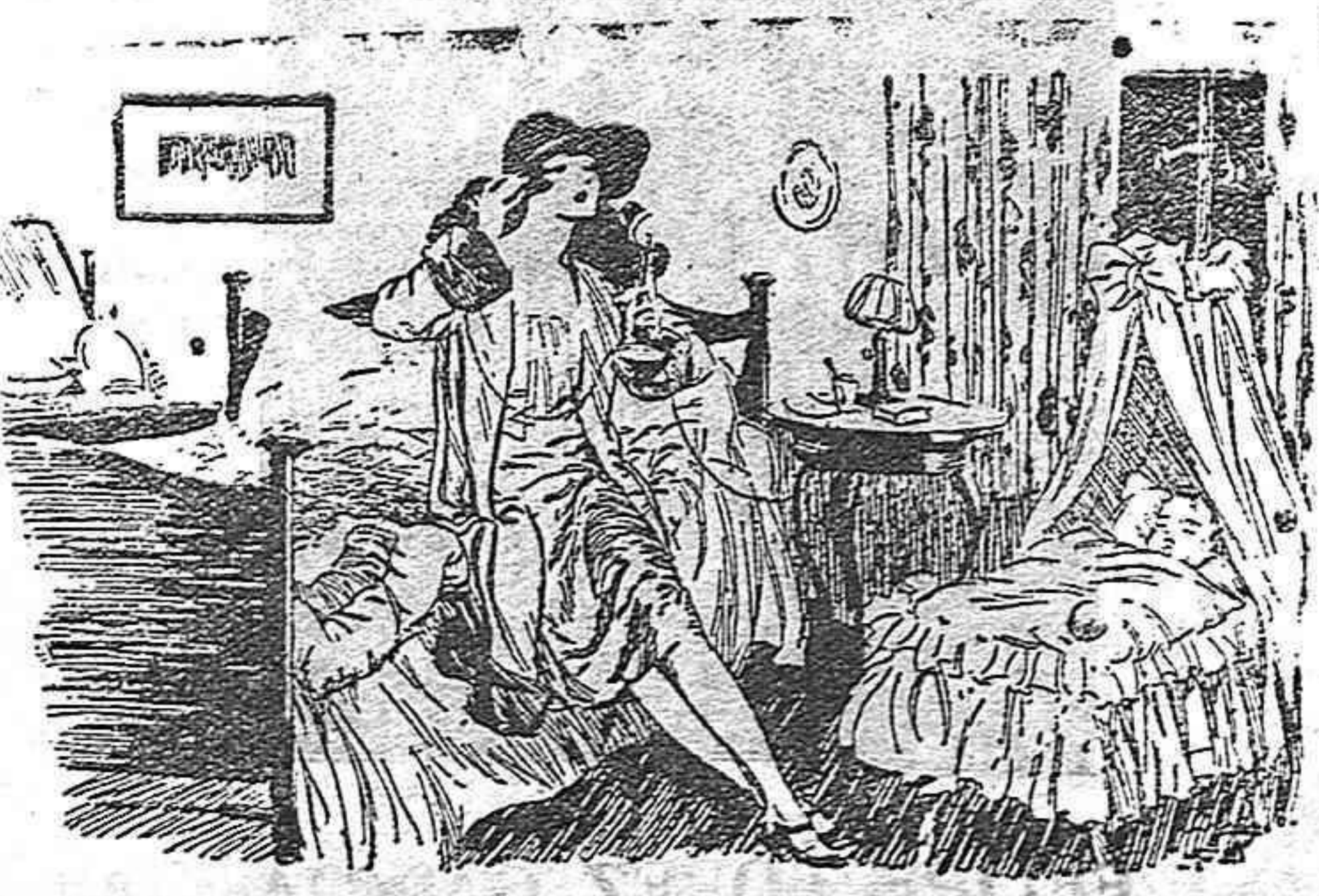
FEMINISMO EN ACCIÓN

Algunos de esos puntos transcritos podrán parecer a nuestros lectores un poco pedagógico. Resulta un poco in-