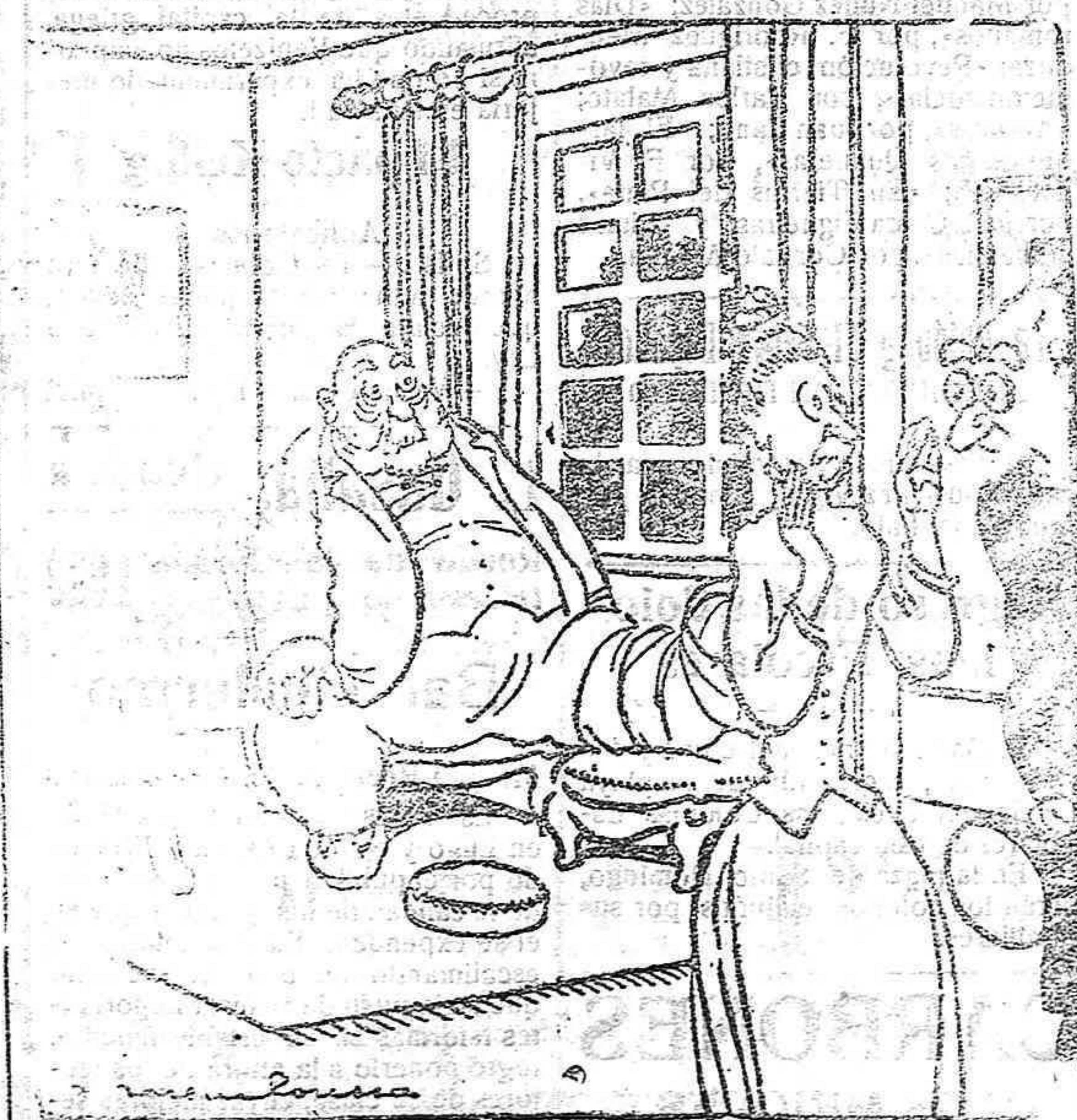
El médico. — Lo que tiene su marido, es un ataque de hidropesía. Se está llenando de agua de un modo alarmante. — ¡Por Dios doctor! ¡que el pobrecito no sabe nadar!

Desde luego, la destrucción de la mosca en estado larvario es mucho