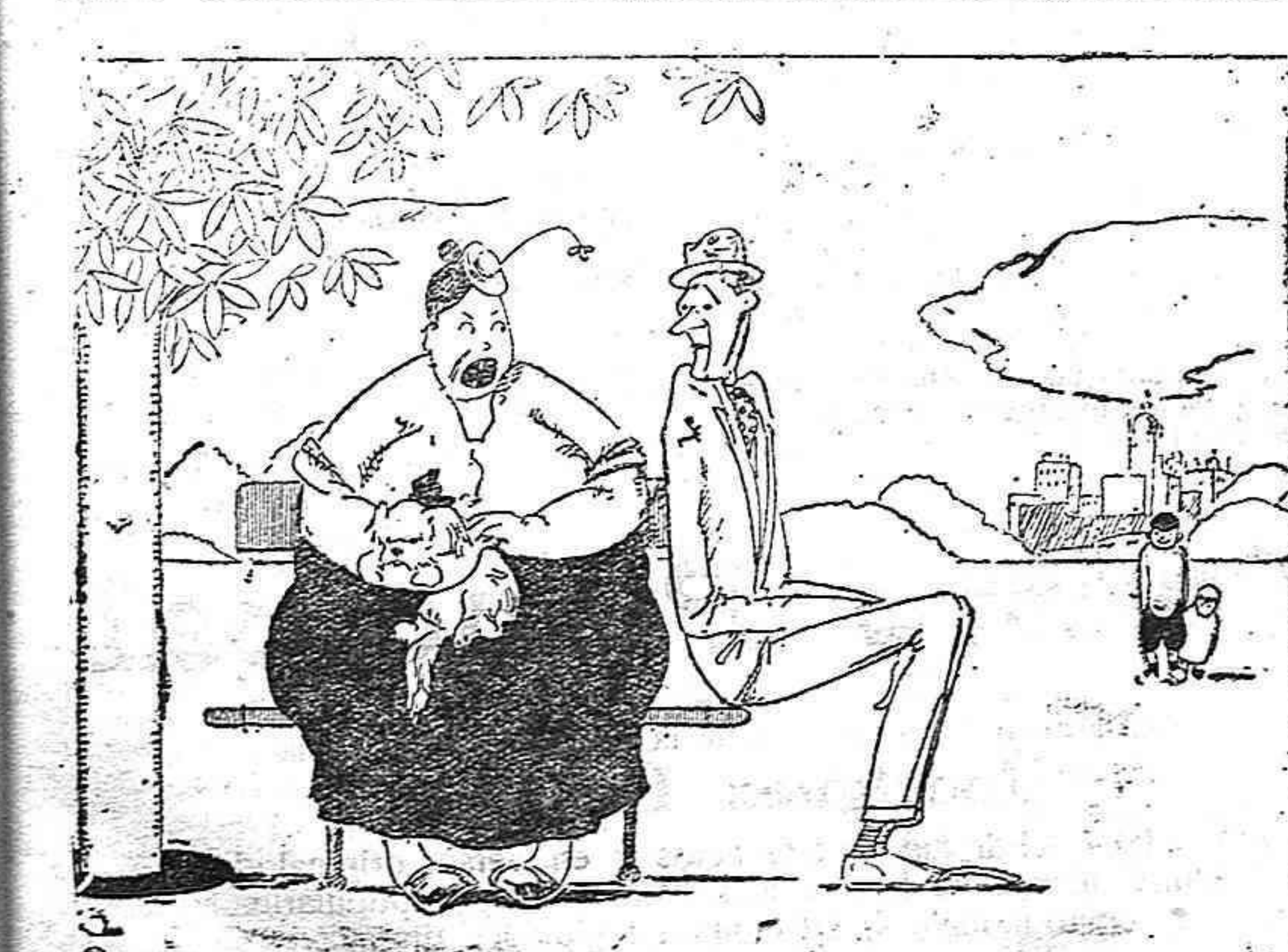
ANSIOSA. — ¡Poncio... véte un poco más allá, que ocupas todo el asiento!