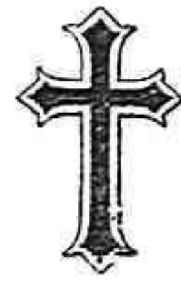
Fig. de EL PROGRESO: MARCELINO DOMINGO

Salga el Sol a las 5'13 y se pone a las 7'11 La Luna sale a las 9'17 de la noche y se pone a las 6'18 de la mañana