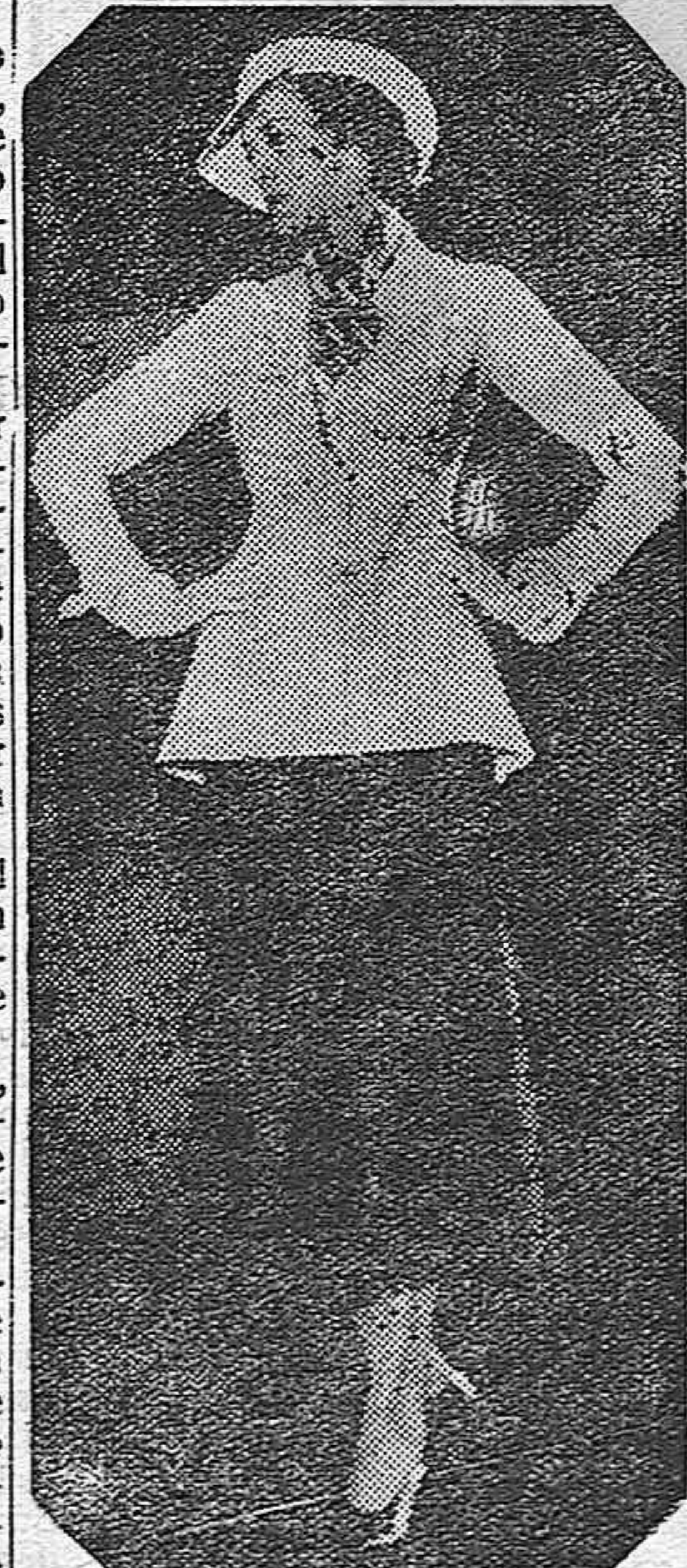
Elegantísima combinación de sombrero y chaqueta blancos con falda de tono oscuro que se estilaba para concurrir a los campos de deporte.