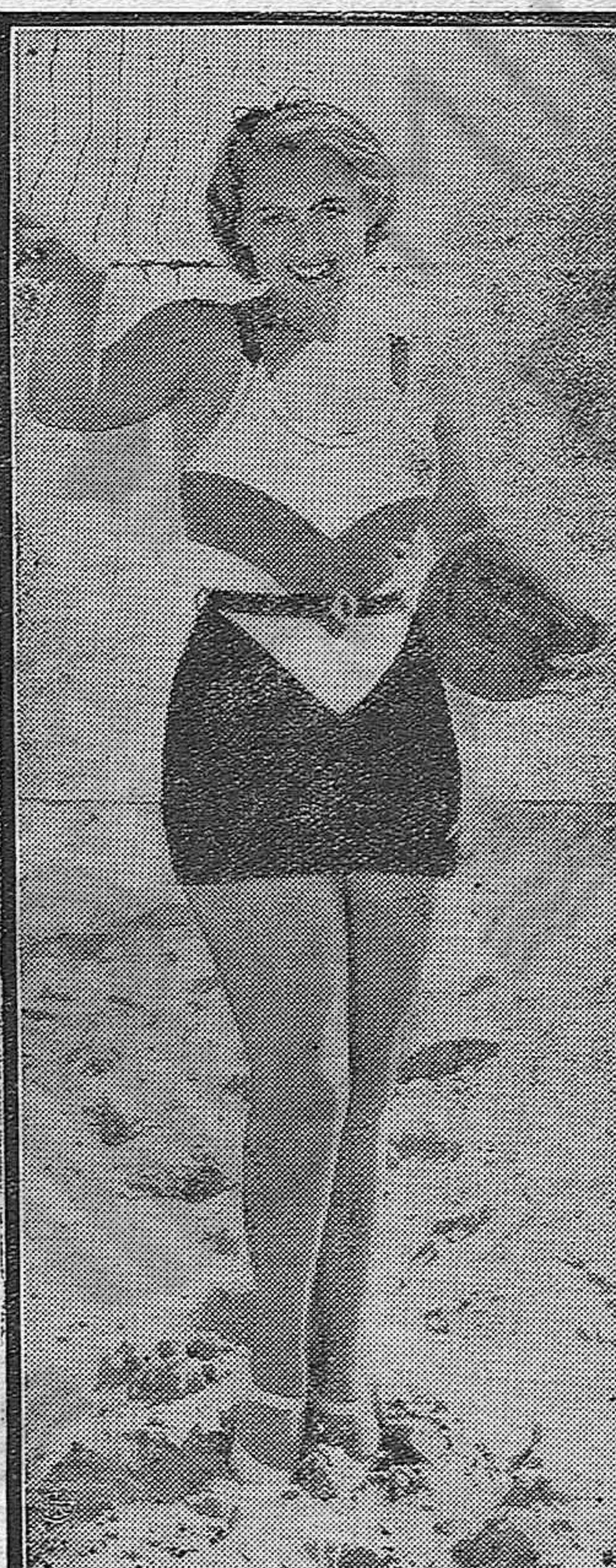
La preciosísima rubia y actriz del Cinema, Joan Blondell, ha tenido el buen gusto de proclamarse reina del balón de las playas de Miami.

Como peliculera está bien, como bañista tampoco lo dudamos y en cuanto al aspecto deportivo creemos contará con muchos admiradores.