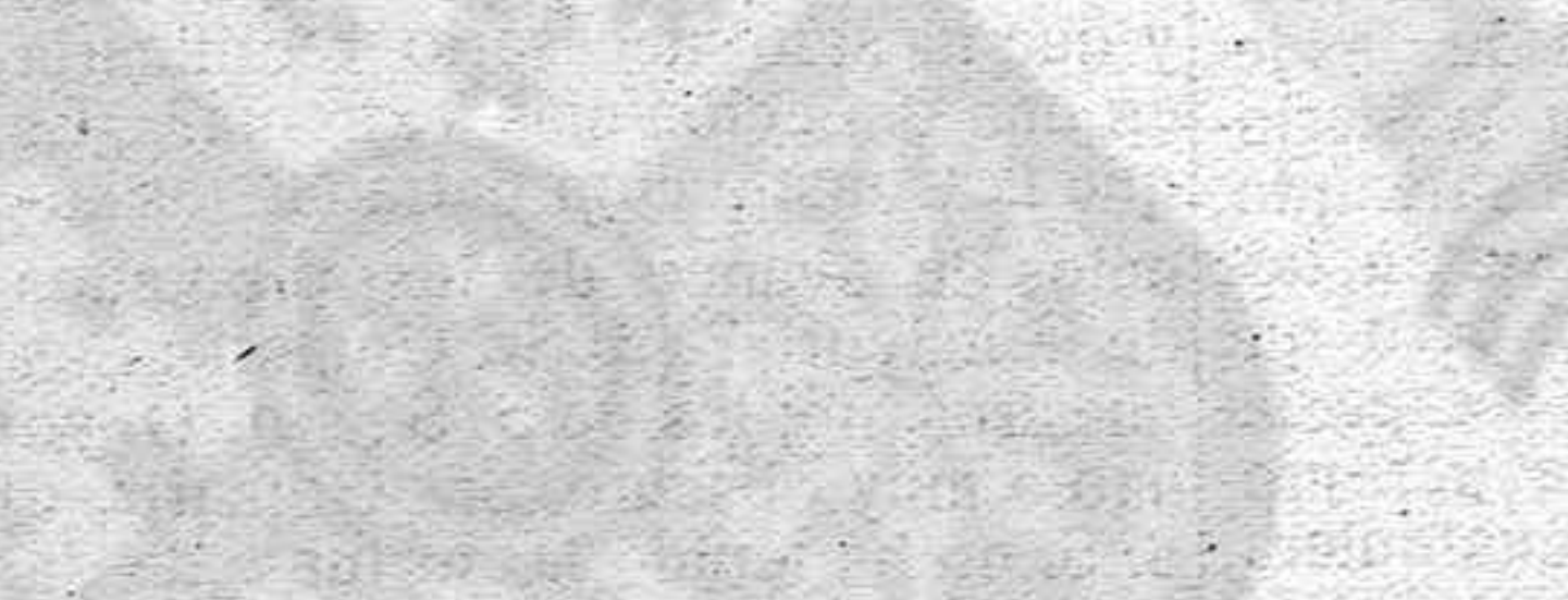
Julio 11 «Monte Olivia» Agosto 8 «Monte Sarmiento» Septiembre 26 «Monte Olivia»

ARLANZA 18 Junio RUBINE HIJOS, Agentes Real, 81.—La Coruña Telegramas y Telefonemas: RUBINE