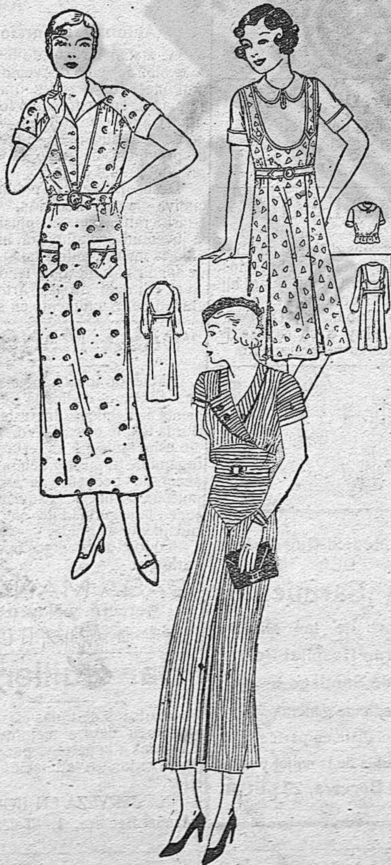
1—Vestido mañanero de lana «cyngalia beige». Hebilla, botones y ribetes marino. 2 Vestido práctico para casa, con pechero y puños de piqué blanco. 3 Traje de niña, compuesto por una falda estampada y blusa de algodón.