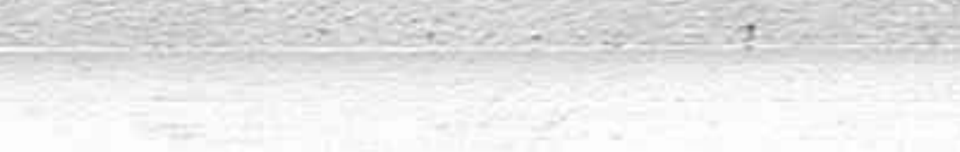
El herido, cuyo estado se calificó de grave, quedó hospitalizado.

De poco tiempo a esta parte, todos los coches norteamericanos son equipados de receptores de radiotelefonía que hacen compatible el manejo del automóvil con la audición de los programas transmitidos por las emisoras.