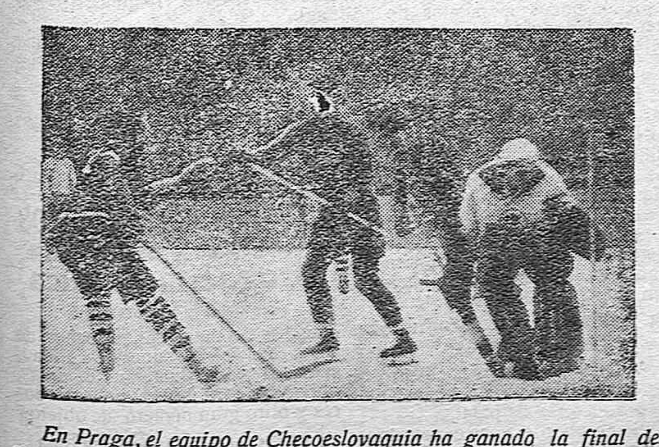
En Praga, el equipo de Checoslovaquia ha ganado la final del campeonato de hockey sobre hielo combatiendo contra el equipo de Austria, por 2 a 0.