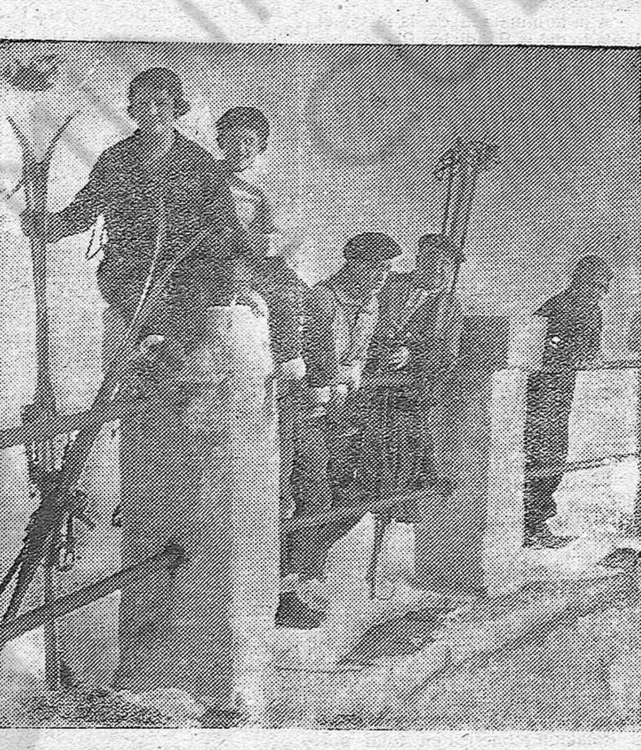
Para finalizar la temporada deportista se han celebrado diversos concursos de esquis que fueron presenciados por muchísimos aficionados y quizá más... «aficionados», pues la legión de montañeros cuenta en sus filas con gran número de entusiastas muchachas que dan singular encanto a las frías jornadas serranas.