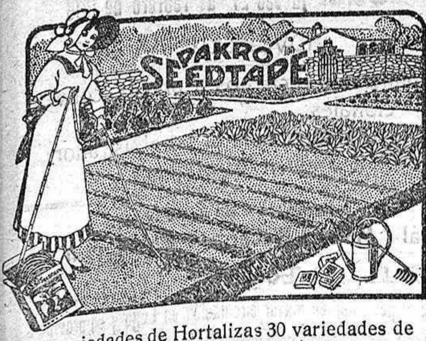
45 variedades de Hortalizas 30 variedades de Flores. Las mismas variedades pueden pedirse en semillas sueltas.