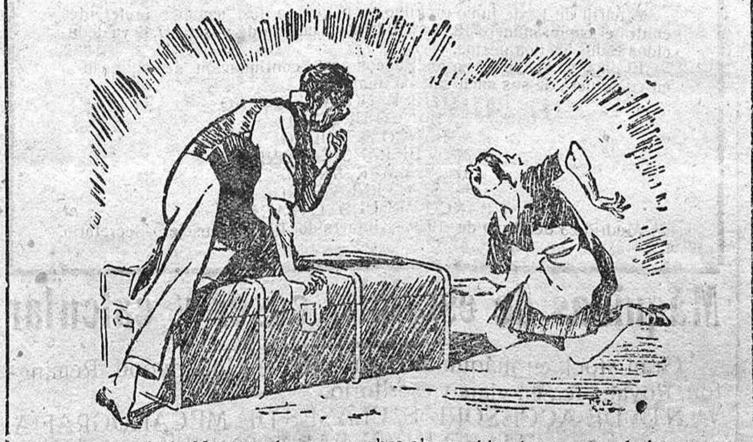
—¡Pero mujer! ¿Me vas a hacer que abra ahora el bañ, con el trabajo que me ha costado cerrarlo?