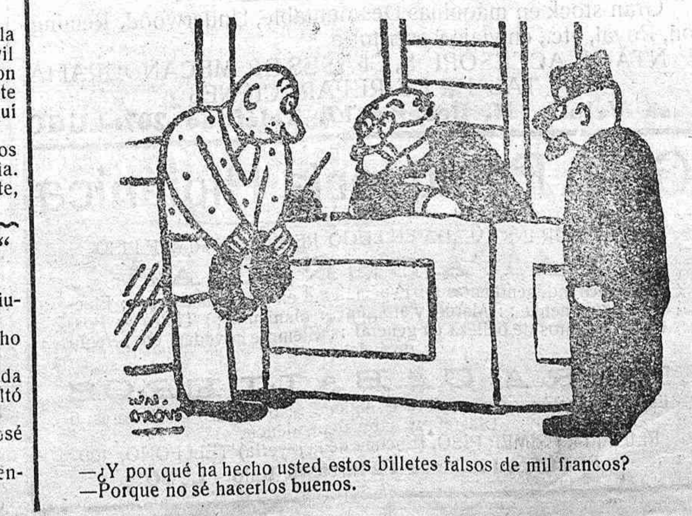
—¿Y por qué ha hecho usted estos billetes falsos de mil francos? —Porque no sé hacerlos buenos.

Al día siguiente, el domingo, a primera hora de la mañana, lo primero que hizo fué cortarle la cabeza con un cuchillo. Le envolvió en algodones y papeles y luego con un cuchillo y una sierra efectuó el descuartizamiento.