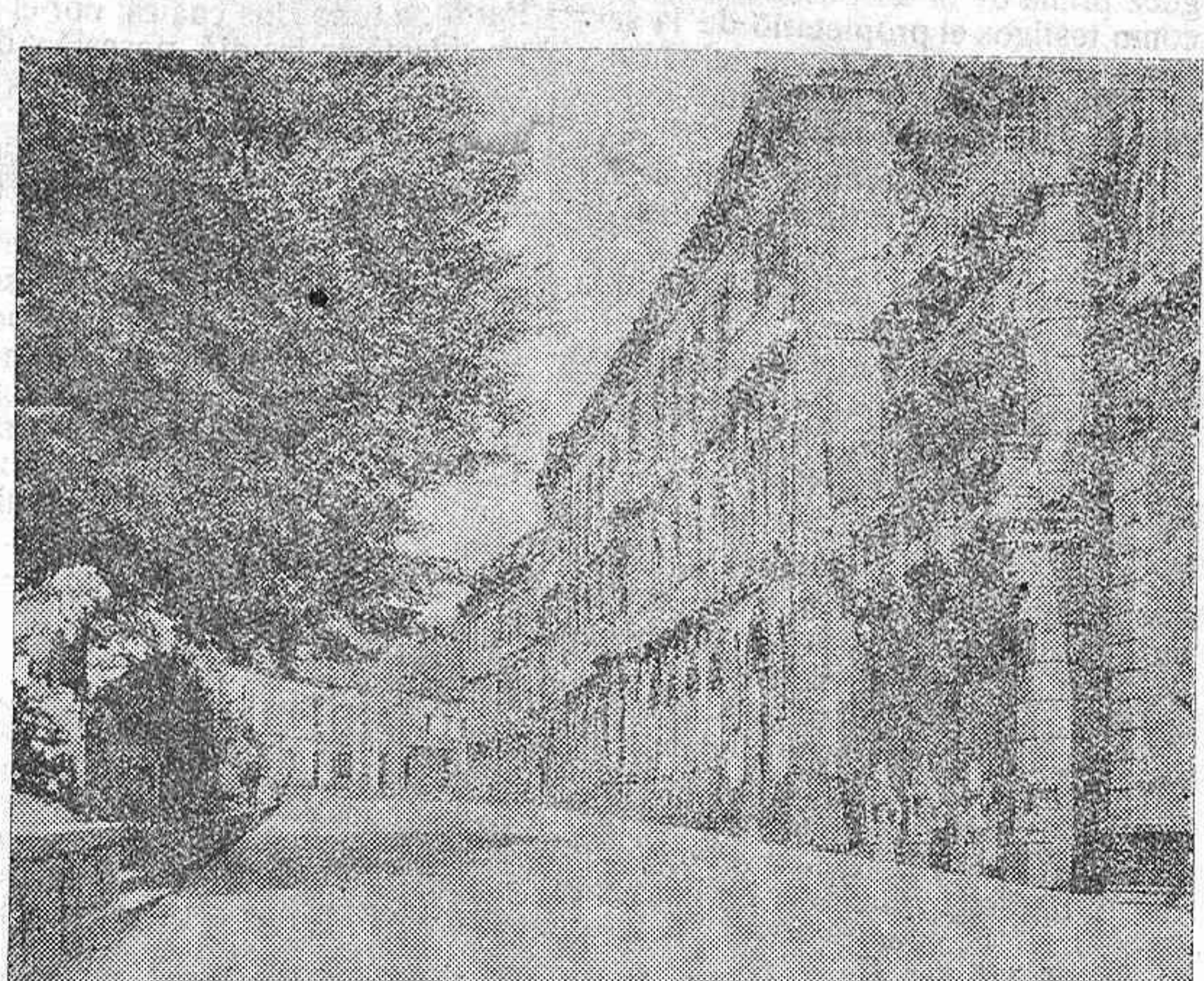
Una de las amplias calles laterales de la Plaza Mayor. Al fondo la calle del Obispo Izquierdo, en donde actualmente se están llevando a cabo importantes obras de pavimentación.