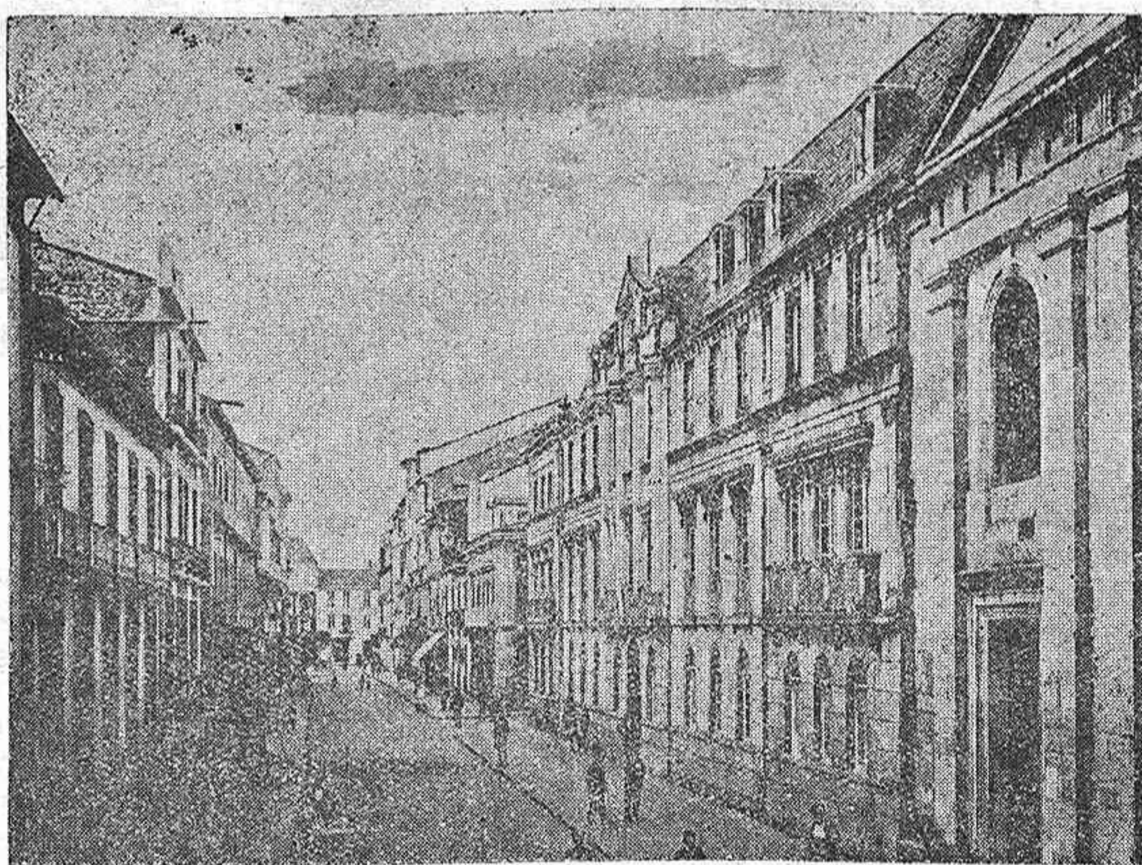
La amplia y populosa calle de la Reina, vista desde uno de sus extremos. A la derecha, en primer término, el edificio de la Delegación de Hacienda.