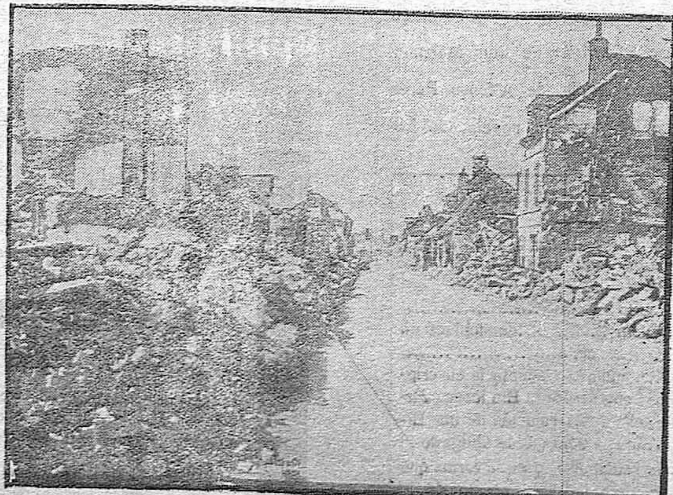
Una calle de Chauny

Por la tarde y noche se celebraron los bailes de tranca que estuvieron concurrenciosos.