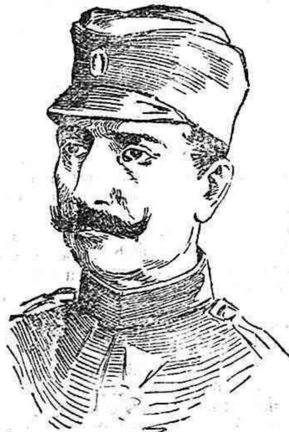
General Boiowitch, nuevo jefe del Estado Mayor Serbio