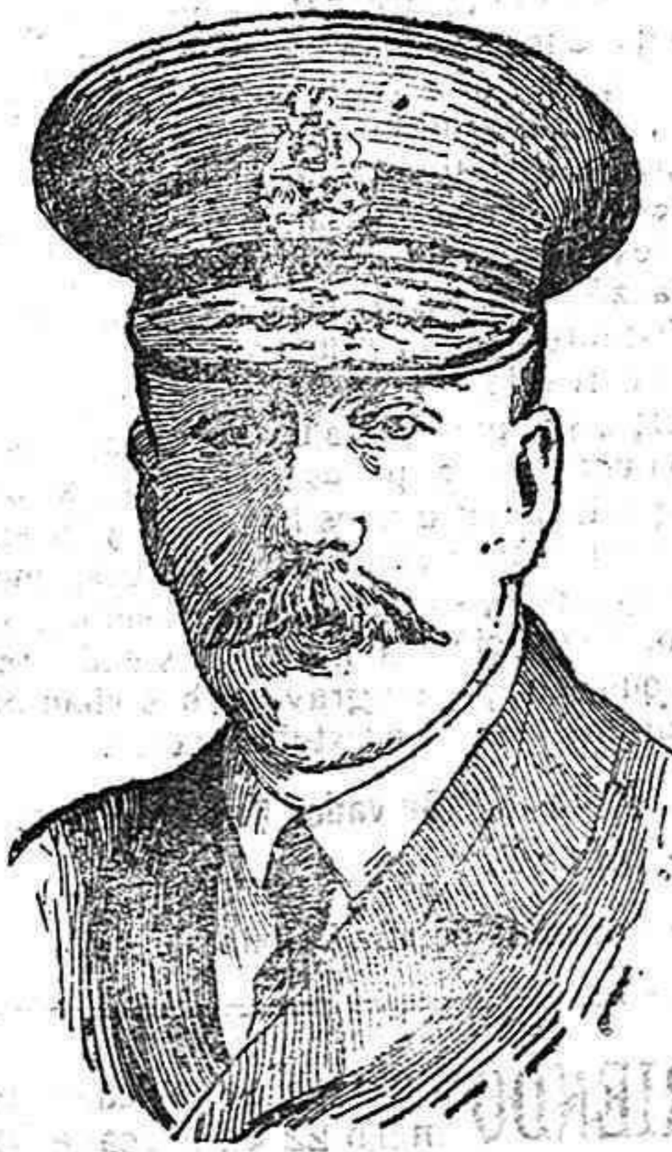
General irlandés STANLEY MANDE, comandante en jefe de las tropas anglo-indias de Mesopotamia que se han apoderado de Bagdad.