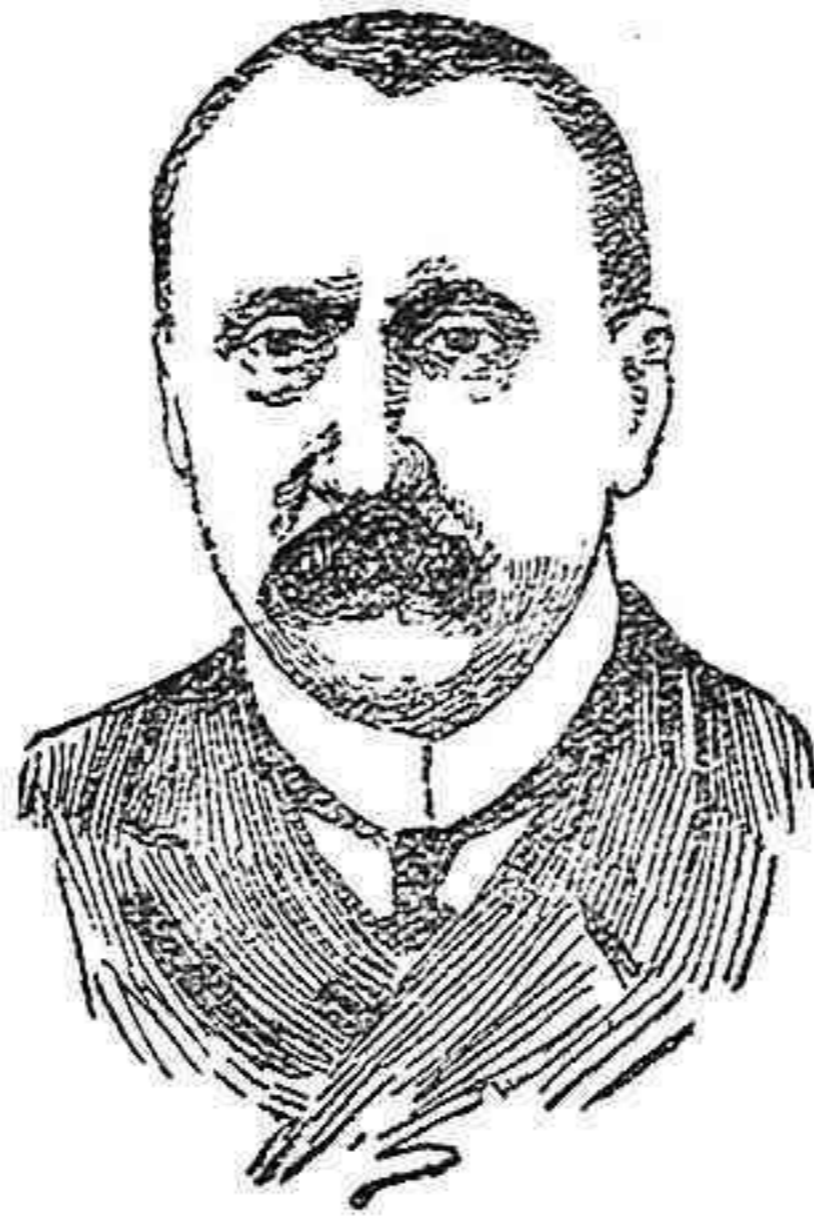
A. Pokrowki, nuevo ministro de Estado de Rusia